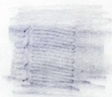
band i nat.storlek