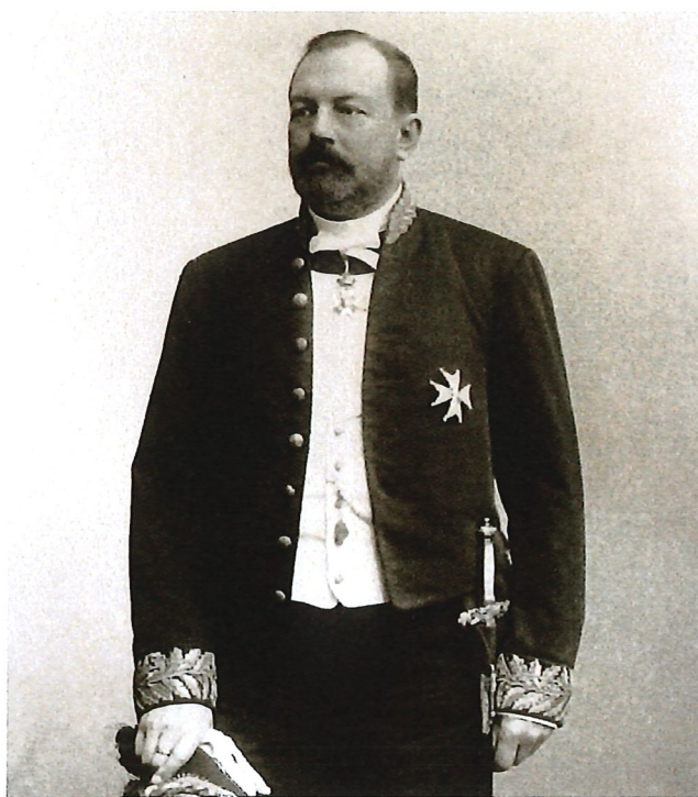
Adolf Fagerlund i landshövdingeuniformen.

nade Kalmar kunde man i Barometern läsa hennes tack för den storartade minnesgåfva, hvarmed medlemmar af Kalmar samhälle och omnäjd behagat hedra mig.