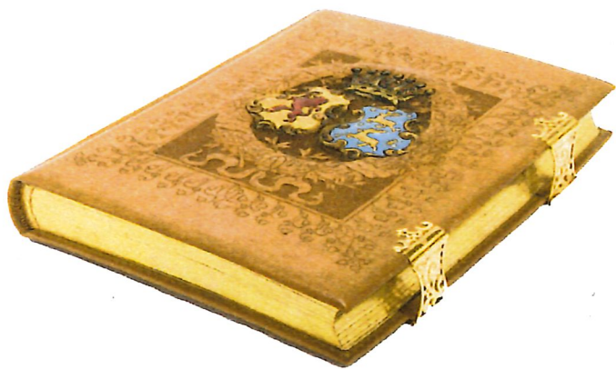
Den praktfulla minnesgåvan.