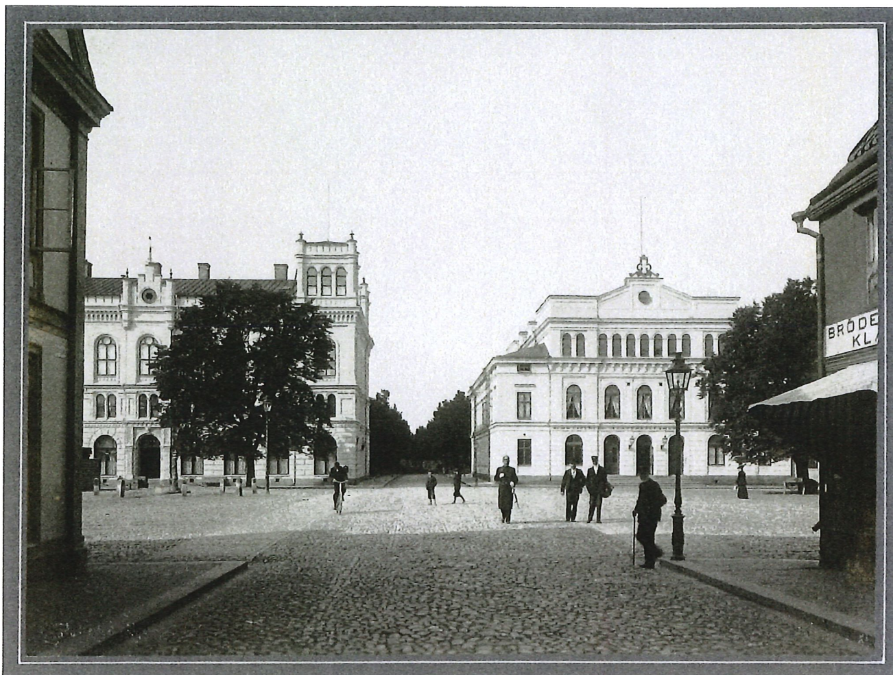
Storgatan i Kalmar mot väster med Larmtorget i mellanplanet och frimurarfastigheten samt teatern i fonden tillhör de vyer som återfinns i albumet. Foto Emil Blomberg 1903. Reprofoto Maria Winsö, Kalmar läns museum.