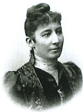
Ett visitkort från Kalmar-tiden med "landshövdingen".

Ångaren Aeolus , namngiven efter vindens gud enligt den grekiska mytologin, var byggd 1884 på Lindholmens Verkstad i Göteborg för Ångfartygs AB Södra Sverige och trafikerade 1884–1910 sträckan Stockholm–Västervik–Oskarshamn–Kalmar och vidare söderut mot Köpenhamn. Efter att huvudsakligen ha gått i linjetrafik högs hon slutligen upp som S/S Ibra 1956. Nu åter till 1903.