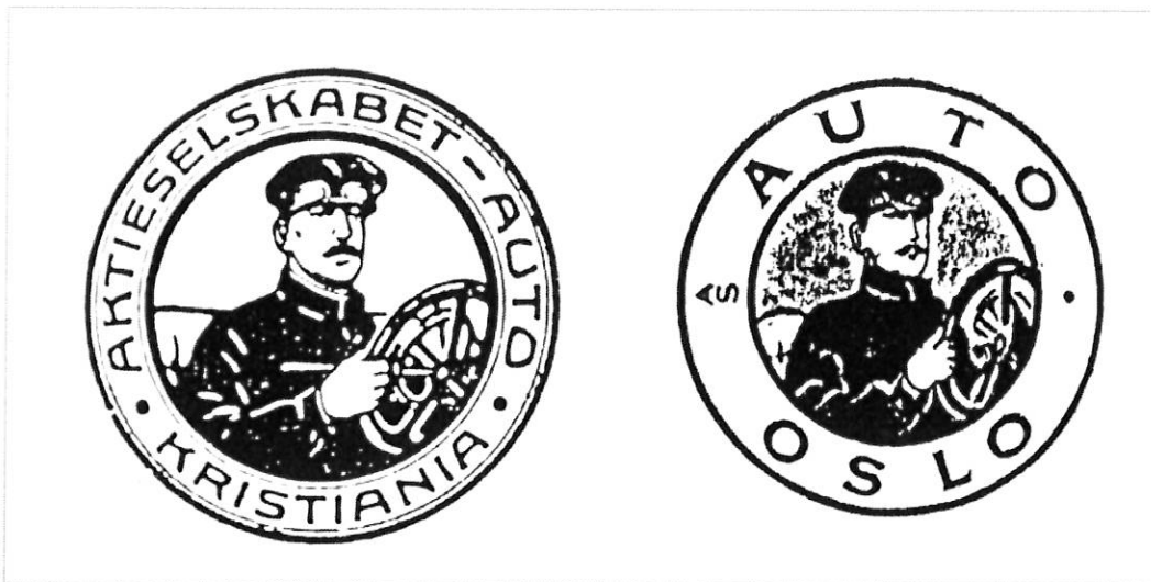
Logoen til A/S Auto før og etter navneskiftet fra Kristiania til Oslo i 1925.