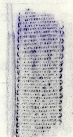
band i nat.storlek