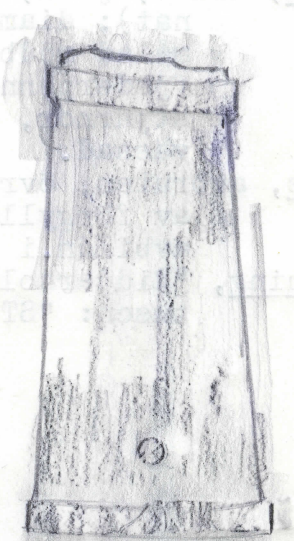
spets i nat.storlek