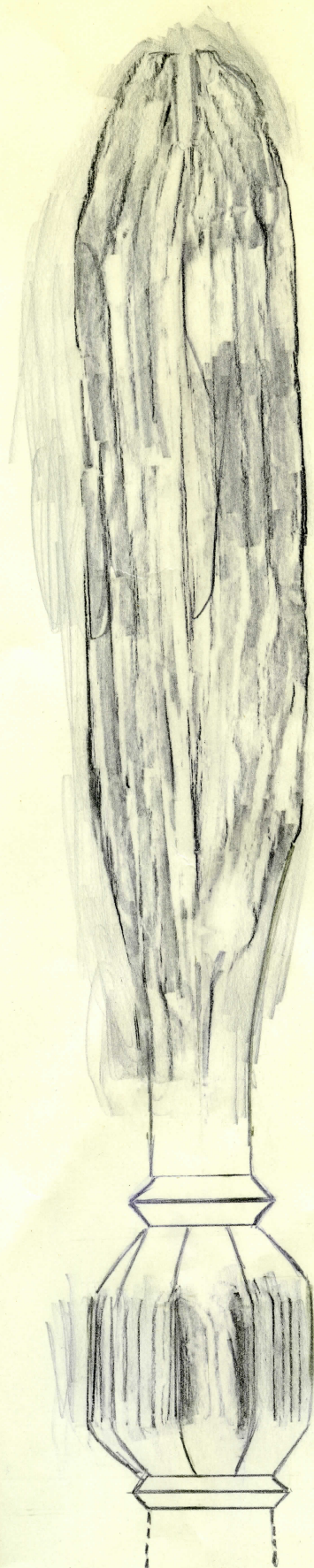
spets i nat.storlek