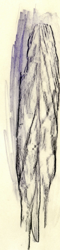
spets i nat.storlek