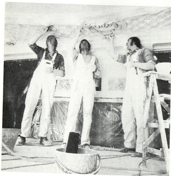
Det var ett omfattande arbete att sätta upp och finputs det rikt dekorerade taket i minnesrummet.