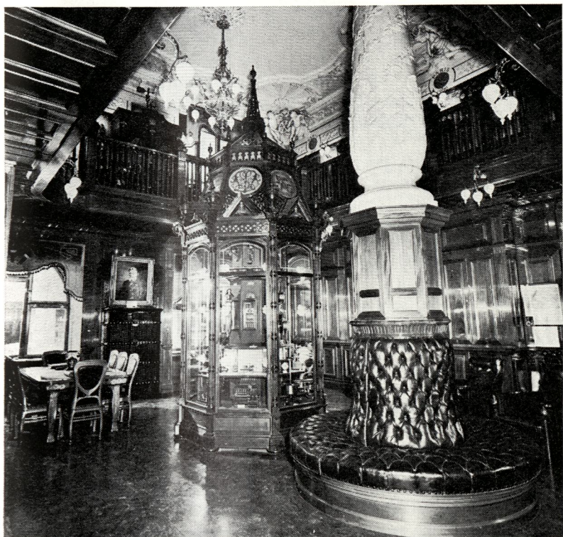
Minnesrummet som det såg ut i LM Ericssons tidigare lokaler vid Tulegatan, före överflyttningen till Telemuseum. Mitt i rummet LM Ericssons monter från 1897 års jubileumsutställning i Stockholm. Montern står nu i museets entréhall.

vackra sammanträdes- och utställningslokaler råkade därmed i farozonen. Den representerade ju, om golv inlades i balkongvåningen, ett utrymme på närmare 150 m 2 som kunde användas för annat ändamål. Hit kom nu fabriken avlöningskontor att förläggas och även en del andra verkstadsutrymmen. Att den vackra inredningen inte for väl av en sådan behandling säger sig självt.