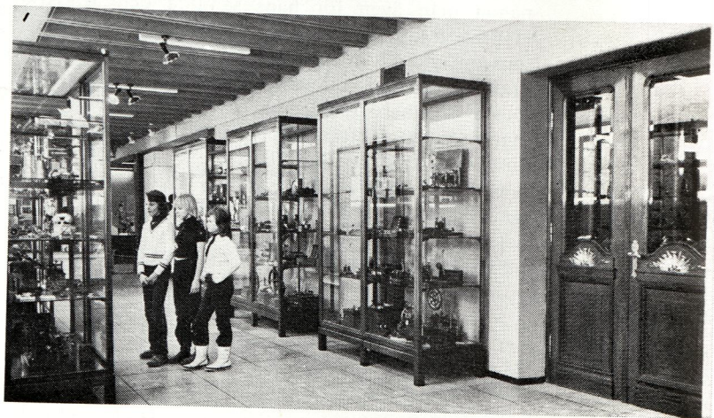
Glasskåp med teledetaljer utanför minnesrummet i väntan på eventuell inflyttning.

De nämnda undantagsåren stördes det goda affärsförhållandet de båda herrarna emellan av att Cedergren tyckte sig spåra ett vikande intresse från Ericssons sida att sköta leveranserna till Allmänna bolaget. Ericsson hade ju också en annan stor kund — telegrafverket. Cedergren startade därför en egen tillverkning av telefonmateriel, AB Telefonfabriken, och frestade därmed hårt på vänskapsbanden mellan de bägge herrarna. 1901 återgick emellertid allt till det gamla, och Telefonfabriken uppgick i Ericssonbolaget. Det är sålunda alldeles i sin ordning att minnesrummet är ägnat åt både L M Ericsson och H T Cedergren och att bägges porträtt pryder dess väggar. Ericsson dog 80-årig 1926, medan Cedergren avled redan 1909, endast 56 år gammal. ■