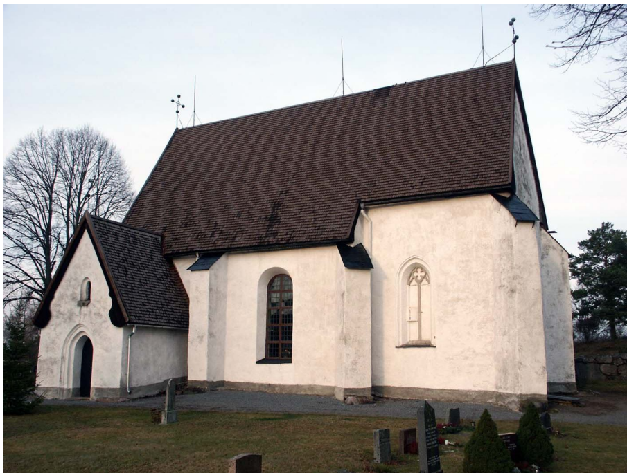
Kyrkan från söder. Det gotiska masverksfönstret i koret är ursprungligt men igenmurat från insidan.