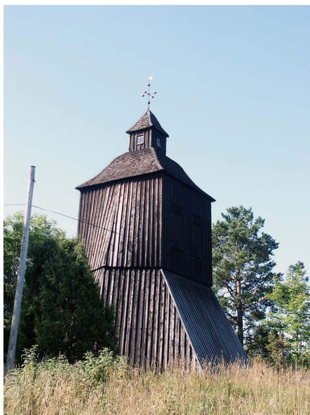
Klockstapeln byggdes 1766 och står på en höjd norr om kyrkogården.