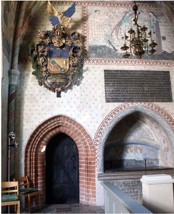
Fru Ramborgs grav ligger i nischen till höger om sakristieportalen. Över nischen finns stenplattan med inskription på latin som berättar om hur Ramborg låtit bygga kyrkan år 1331.