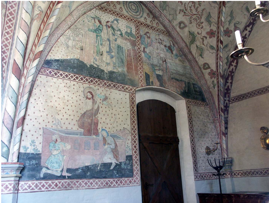
Här ses de smäckra valvribborna som vilar på pelare med kapitäl. Målningarna togs fram redan 1870 och kompletterades av konstnären J. Z. Blackstadius.