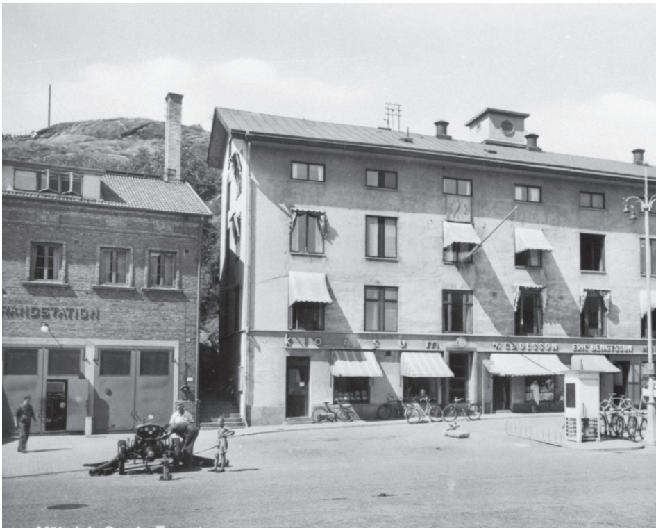
Gamla Torget, 1935-40-tal. Från vänster ligger brandstationen (Kvarnbygatan 41) och gamla stadshuset (Kvarnbygatan 43) samt Hedströms hus (Roten F9). Bilden är tagen efter 1935, då stadshuset putsades för att se ut som sten och då brandstationen stod färdig. Högst upp på gamla stadshuset finns "Slangtornet" där brandstationens slangar torkades.

finns även en ny mjuk heltäckningsmatta, delvis nya möbler och andra omsorgsfullt renoverade detaljer som då salen var ny 1962.