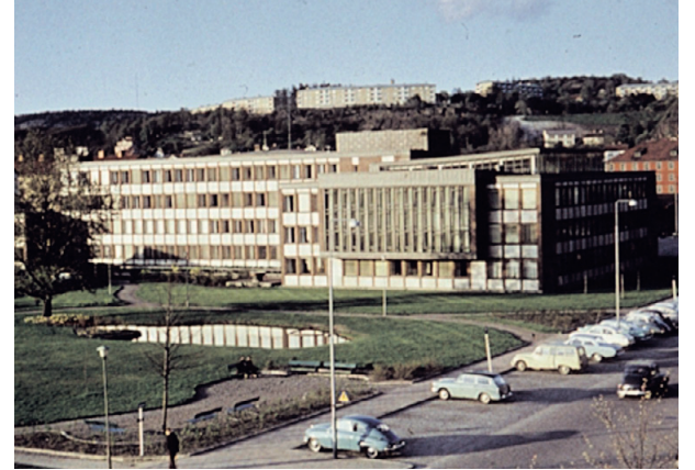
Stadshuset med det stora fönsterpartiet sett från Stadshusparken. Cirka 1965.