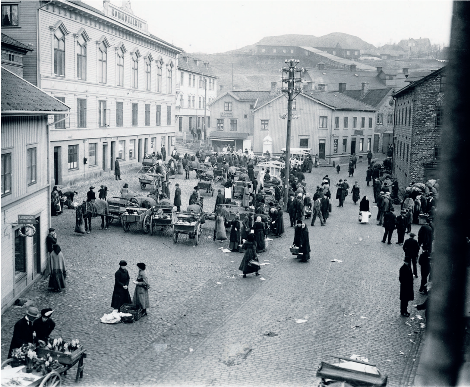
Gamla torget. Mölndals första stadshus ligger till vänster i bild, 1921.