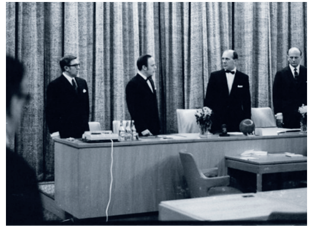
Sessionssalens podium med råsidenridå i bakgrunden.