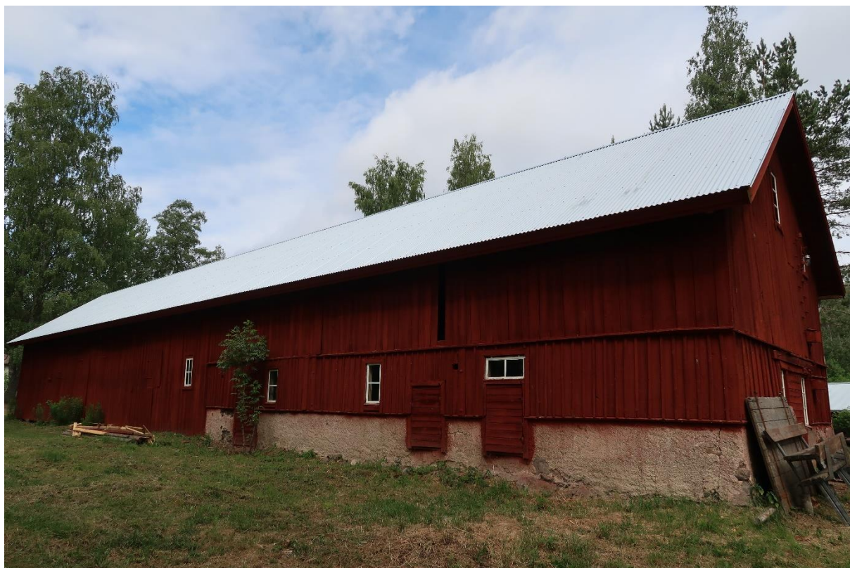
Södra sidan efter att taket lagts med sinuskorrugerad plåt.

Vid första besöket, inför arbetena, diskuterades behovet av hängrännor. Föreningen önskade sätta upp hängrännor på den norra sidan av byggnaden för att skydda fasaden samt besökare då entréerna ligger på norra sidan. Även för att skydda den nya uteplatsen/dansbanan och rampen upp till densamma. Antikvarisk medverkan godkände hängränna på norra sidan, med utkast. Vid en senare besiktning hade hängränna med stuprör monterats. Stuprören hade rundade vinklar. Ur antikvarisk synvinkel hade stuprör med skarpa vinklar varit att föredra. De nu befintliga stuprören är dock förhållandevis diskreta och möjliga att ersätta vid ett senare tillfälle.