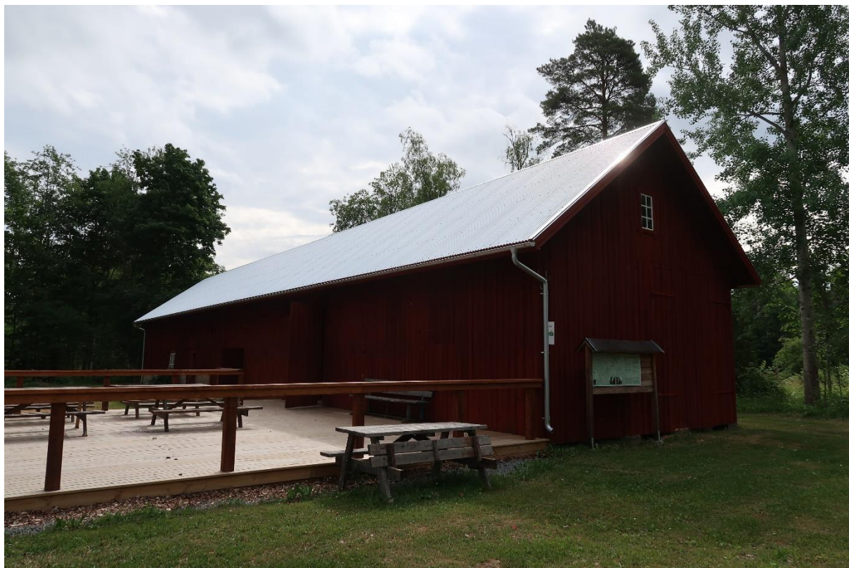
Ladugården, norra sidan, efter att taket åtgärdats.

Takfotsbrädor har också monterats för att skydda ändträet på takkonstruktionen samt för att dölja eventuell skillnad i nivå på taket efter att det riktats.