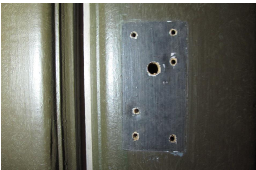
Vindfång i väster. Bilden till höger: Den ursprungliga kulören i blåsvart, på ramverket i portarna, syns bakom borttaget beslag.