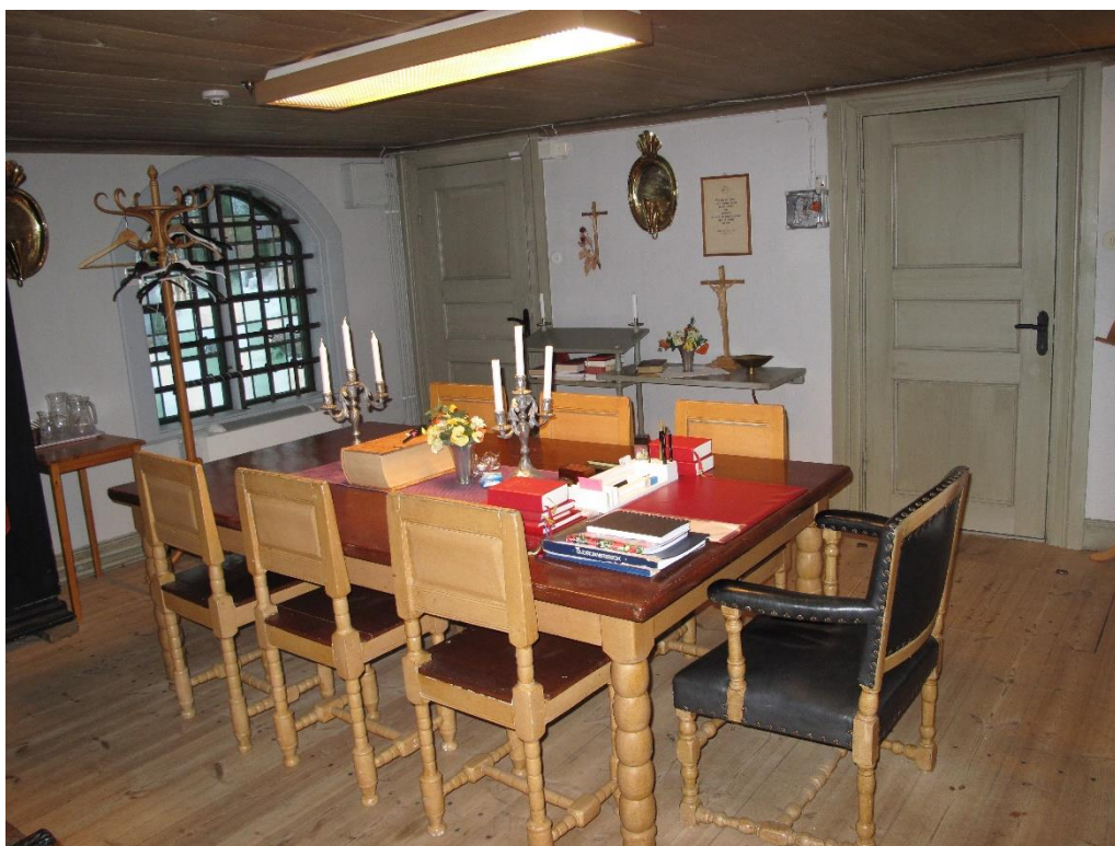
Sakristian har byggts om sedan restaureringen 1929. Troligtvis ett äldre möblemang, eventuellt med ny färgsättning.

Sakristian har mycket lite kvar från restaureringen 1929.