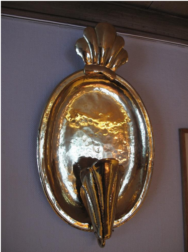
Lampett av mässing.