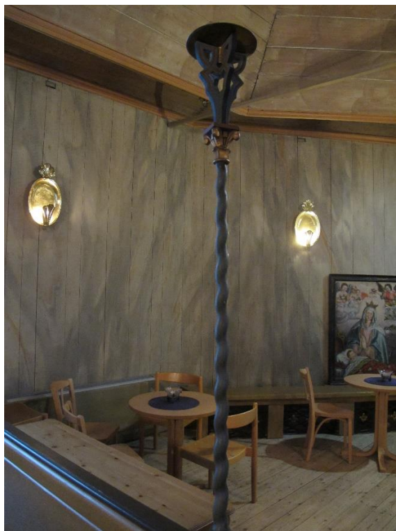
Till vänster, korvalvets målning "Den eviga staden". Till höger, del av dopkapellet där man kan se väggarnas marmorering, lampetter samt en av de skulpterade ljusstavarna som markerar ingången till dopkapellet.