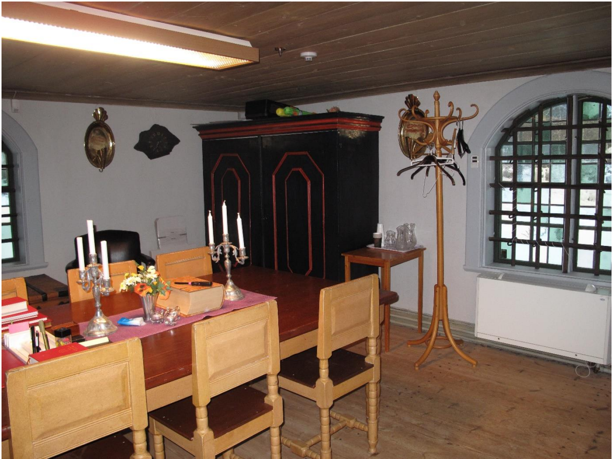
Skåpet i bakgrunden fick troligtvis sin färgsättning i samband med restaureringen 1929.