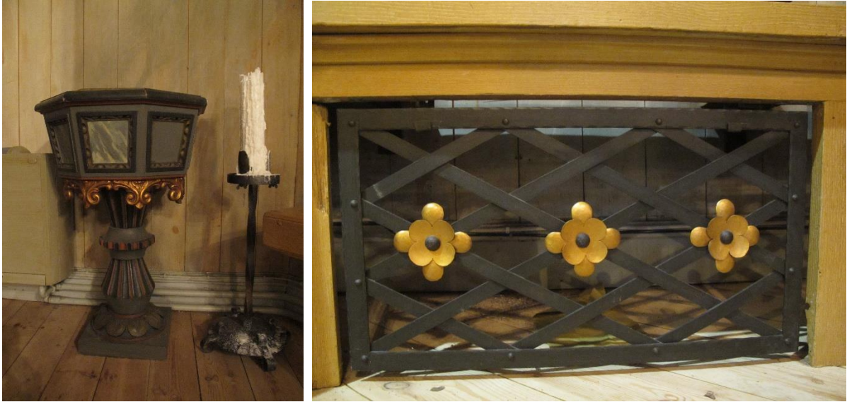
Dopfund med dopfat i driven mässing daterat 1929. Till höger, bänk i dopkapell med dekorativt utformat galler.