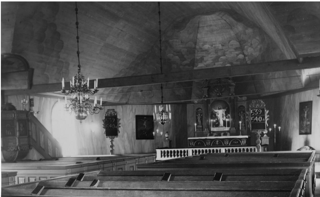
Hällefors kyrka 1936.

Konserveringsåtgärder utfördes som tidigare nämnts på kyrkans takmålningar som togs fram och rengjordes. Predikstolens ursprungliga målning togs fram och konserverades. Övrigt målningsarbete som tidigare ej nämnts var orgelfasad, läktarbarriärens framsida samt läktarstolpar. Bänkarnas yttersidor så som skärmar, dörrar och gavlar samt bänkarnas insidor och bokbräddor marmorades eller ytbehandlades på annat sätt. Altarring, altarbord och altarpuppssats ommålades och dekorerades i överensstämmelse med övrig inredning, med helt eller delvis bibehållande av dåvarande förgyllning.