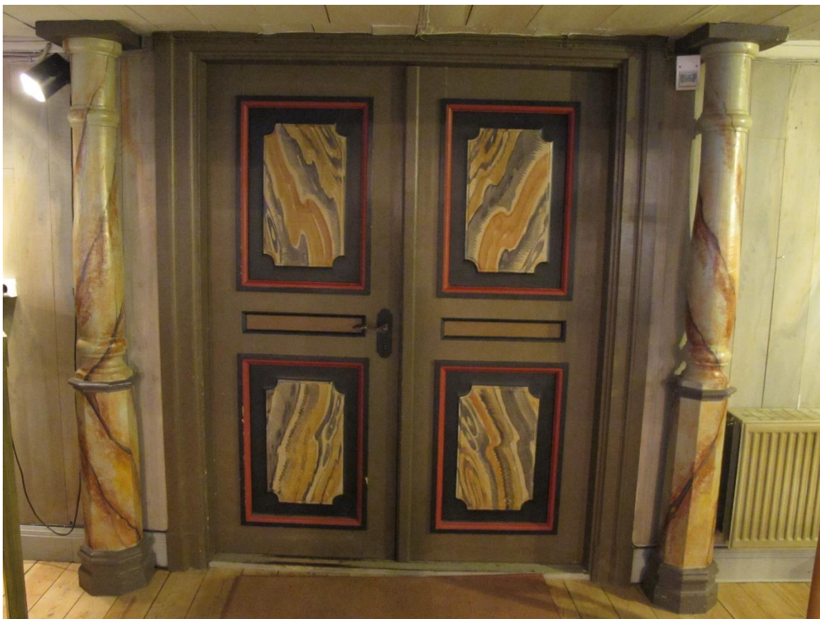
Pardörr mot vapenhuset i väster vars speglar givits en kraftfull marmorering.