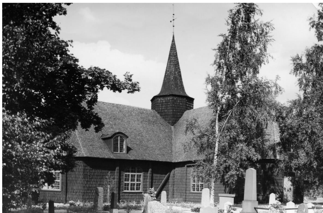
Hällefors kyrka 1936.

Hällefors kyrka har en korsformad plan med avfasade hörn. Den är byggd av timmer med vidbyggd sakristia i öster. Väggarna är spånklädda och rödfärgade. De sadelklädda taken med valmade spetsar, är även de spånklädda. Korsmitten kröns av en takryttare med spetsig spira, även den spånklädd. Entréer till kyrkan finns i västra samt södra korsarmen. Kyrkorummet med sitt höga tunnvalvda tak, där predikstolens ljudtak ingår i takkonstruktionen, fick sitt nuvarande utseende vid en omfattande restaurering 1929 med syfte att återställa kyrkans äldre interiör, en tidig restaurering i sitt slag, av arkitekten Erik Fant.