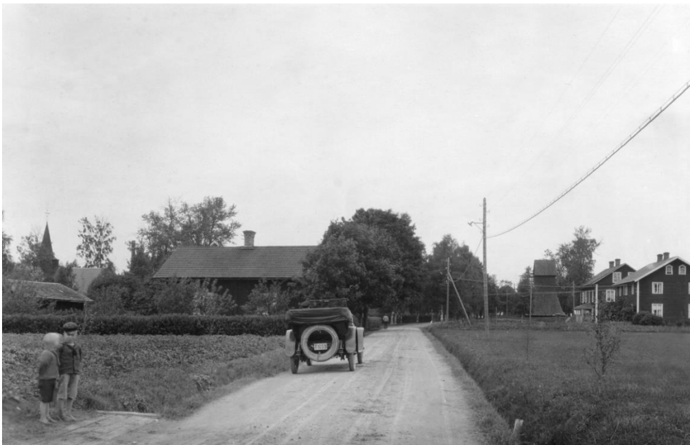
Hällefors kyrkby 1931.

I samhället växte bebyggelse upp kring de olika verksamheterna. I dag finns Hellefors herrgård från 1784, nära den plats där bruket en gång låg. Brukets ägare lät 1796 anlägga Krokbornsparken, en plats för rekreation och nöje för brukets anställda. I Hällefors finns också Sörgården, f.d. huvudbyggnad till Saxå bruk. Ursprungligen byggd ca 1800 men som i början på 1900-talet flyttades till Hällefors för att tjäna som brukshotell och tjänstemannamäss. Redan i slutet av 1930-talet byggdes ett funktionalistiskt kommunhus i gult tegel. Här finns också områden med omfattande egnahemsbebyggelse från 1920-40-talet samt landets äldsta pensionärsbostäder från omkring 1940. Under 1900-talets slut har kommunen bland annat satsat på form och design vilket resulterat i ett flertal skulpturparker samt uppförandet av Formens hus i början av 2000-talet.