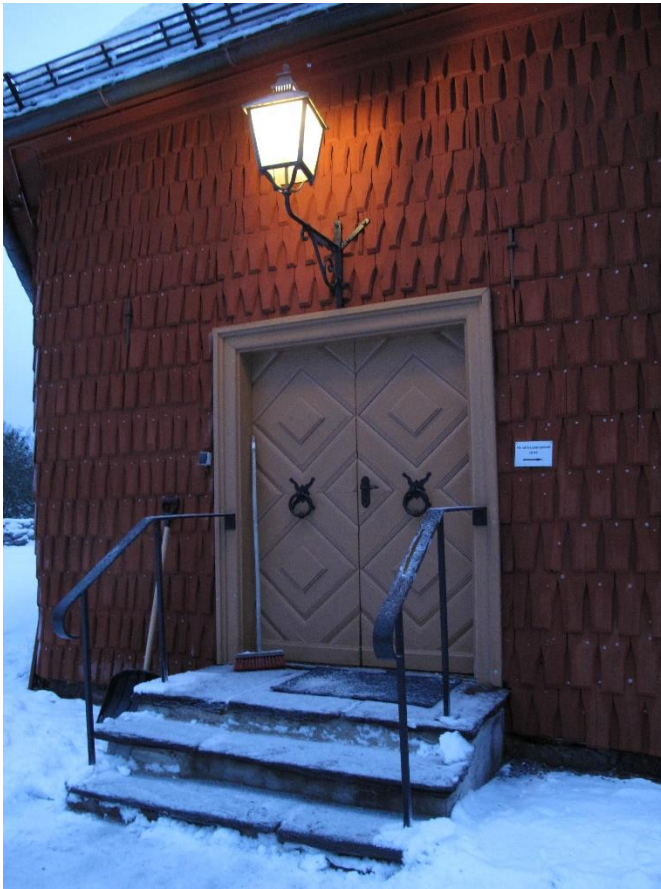
Nya entréer från 1929 samt fönsterbågarna som 1929 förses med blyspröjsat antikglas.

Entréerna präglas av restaureringen 1929.