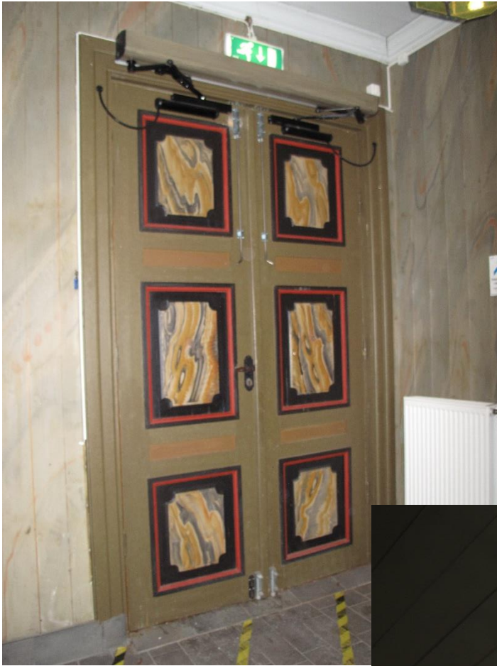
Bilden ovan: Entréportar i södra vapenhuset. Bilden till höger: Armatur i blyinfattat glas. Observera de marmorerade väggarna.