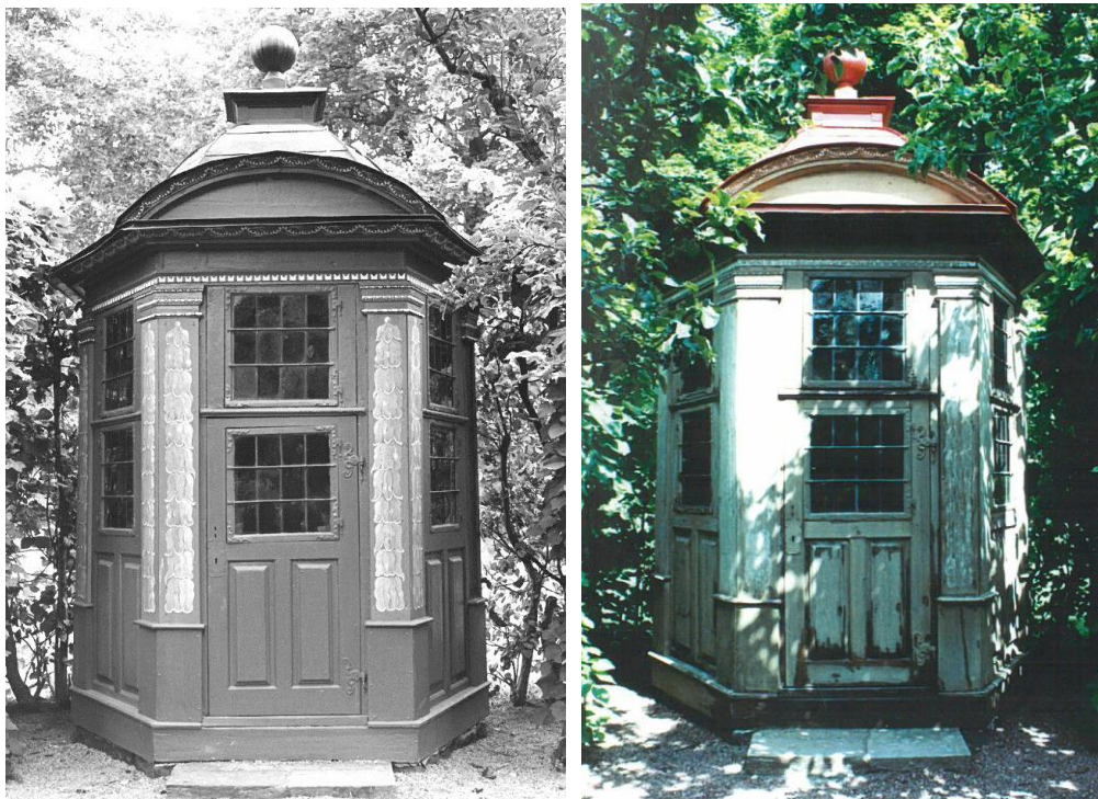
T.v. Figur 5. Efter renoveringen 1982.