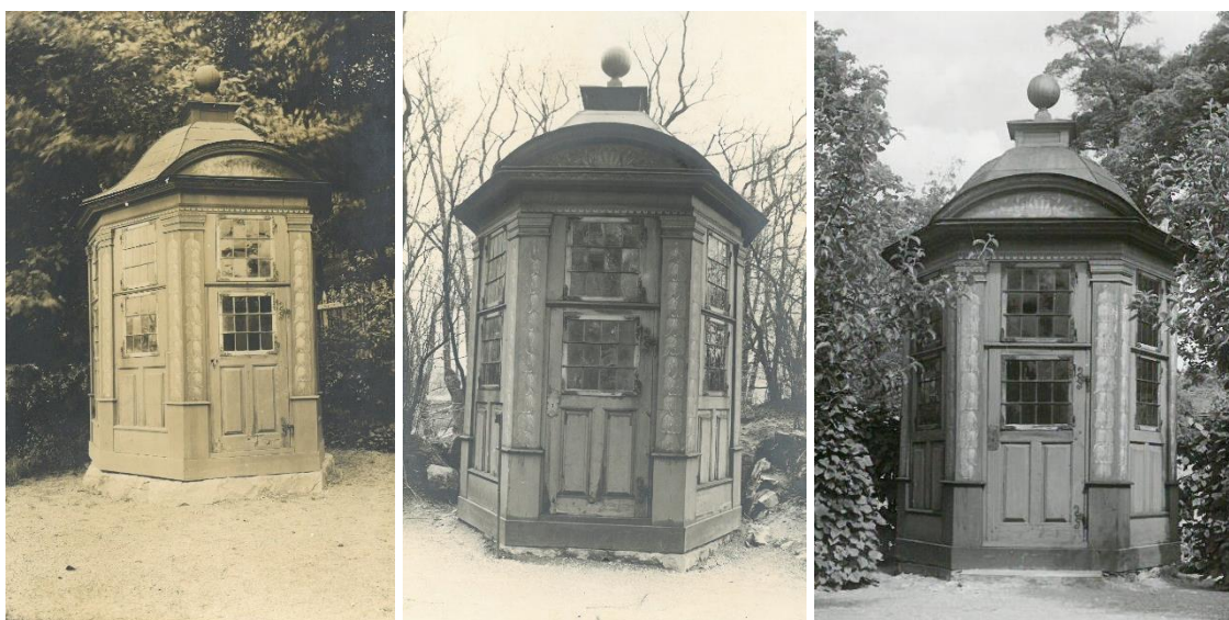
T.v. Figur 1. Lusthuset på Framnäs 1905.