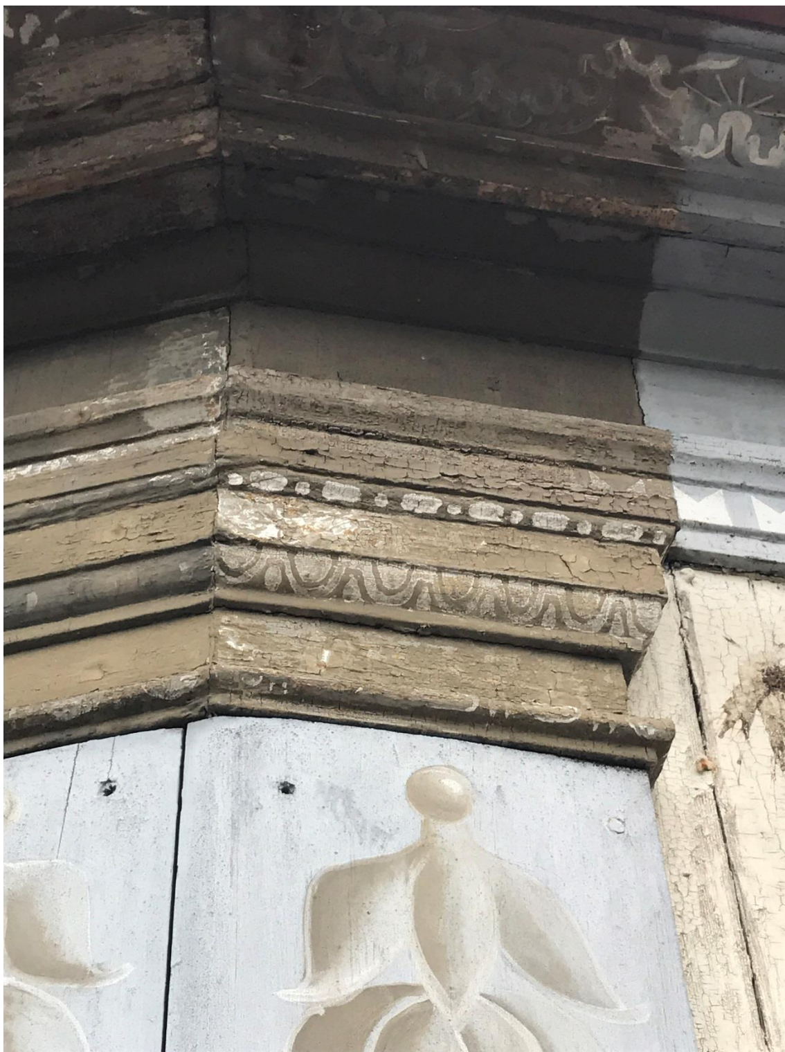
Figur 15. Referensytan börjar krackelera och släppa i färgen.