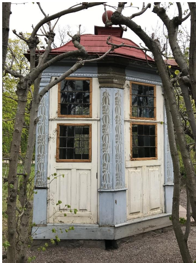
T.v. Figur 9. Fasad mot norr. Algpåväxt på panel och takplåt samt slitna färgskikt.