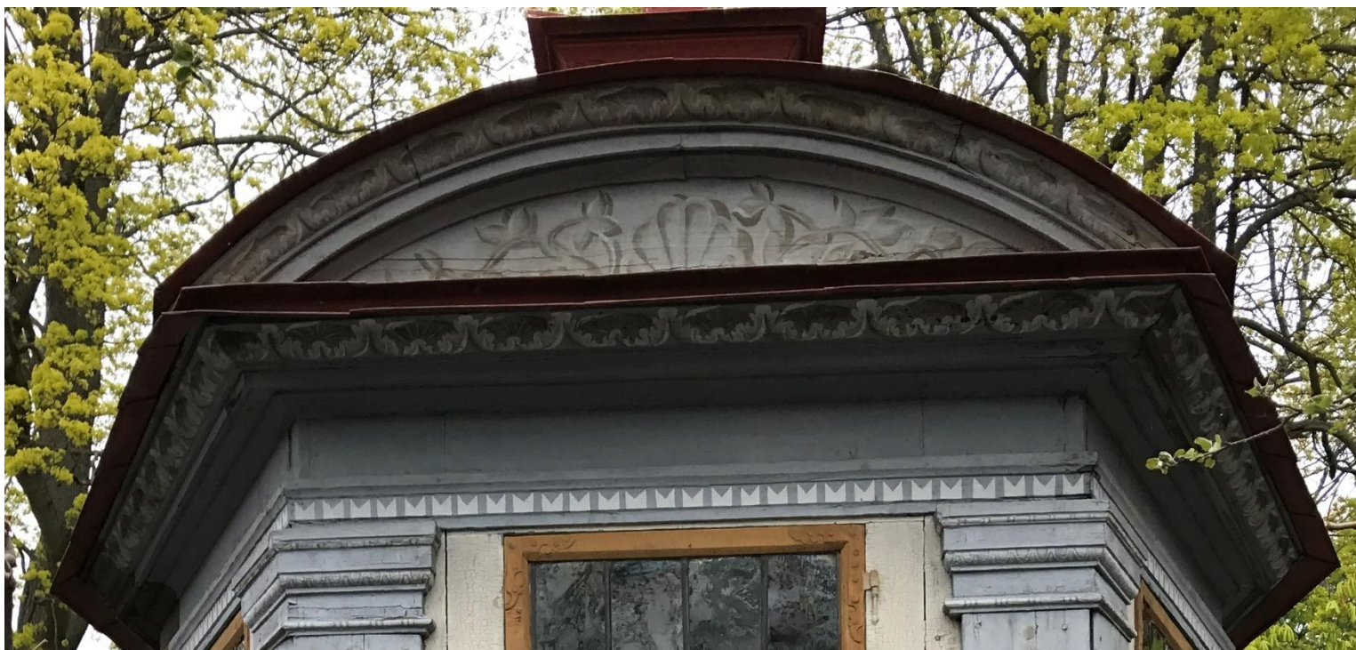
Figur 16. Närbild på dekormålning och fronton.