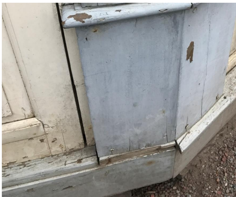
T.v. Figur 11. Nedsmutsning och färgbortfall samt sprickor i fyllning av trä.