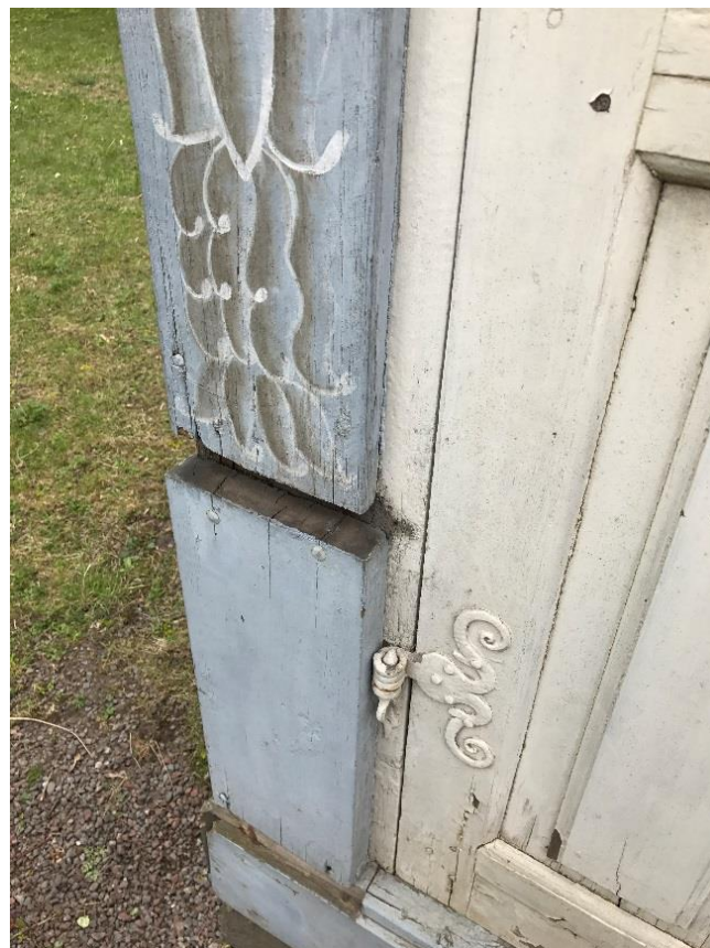
T.h. Figur 14. Saknad list på bakre pilaster mot väster.