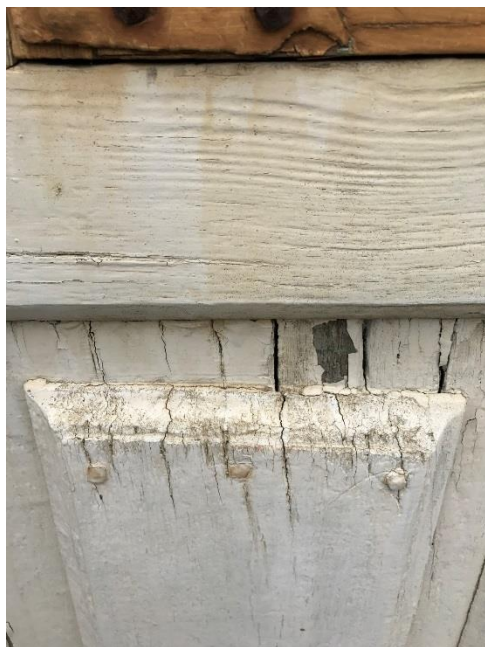
T.h. Figur 10. Fasad väster med referensyta.