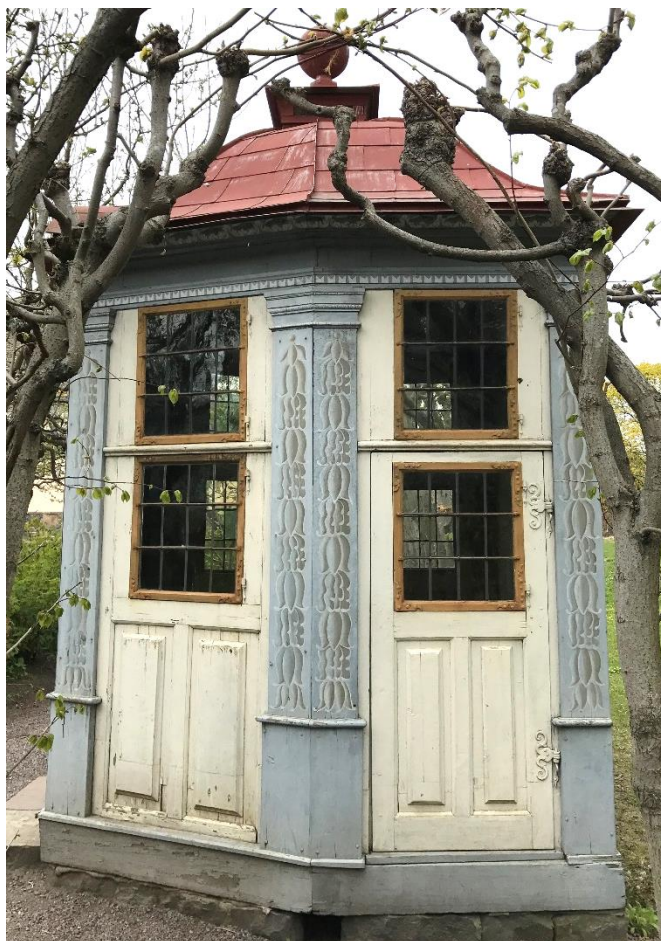
T.v. Figur 7. Främre fasad mot söder och köksträdgård. Uppvisar allmänt färgbortfall, sprickor och krackelering. T.h. Figur 8. Fasad mot öster.