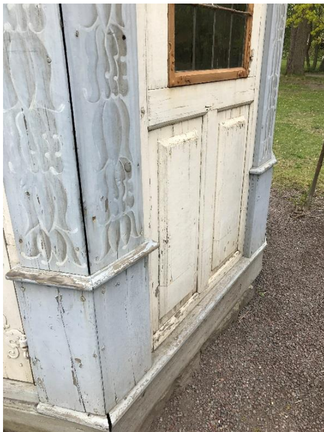
T.v. Figur 13. Hörnen på sockellist och pilastrar glider isär.