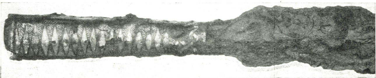
FIG. 8. 1/1.

ån anträffats ett svärd jämte ett människoskelett. På anmodan insändes fyndet till vårt museum till påseende och har sedermera för detta förvärvats.