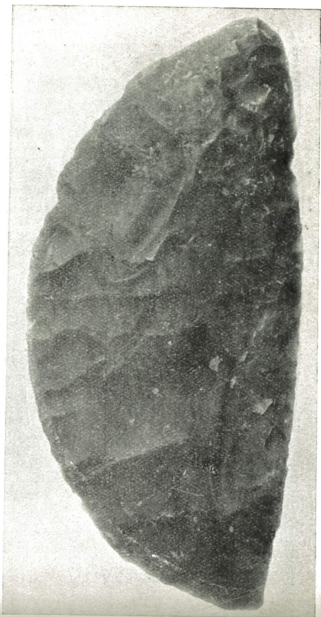
FIG. 5. 1/1.

av nötning mot ett trähandtag, kan med lika berättigande tillskrivas långvarig nötning vid glättning.