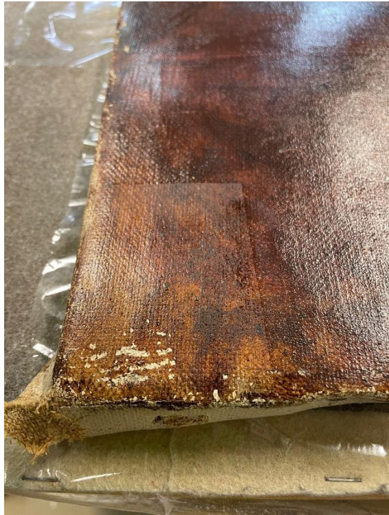
Avlägsning av fernissa med Evolon och etanol.