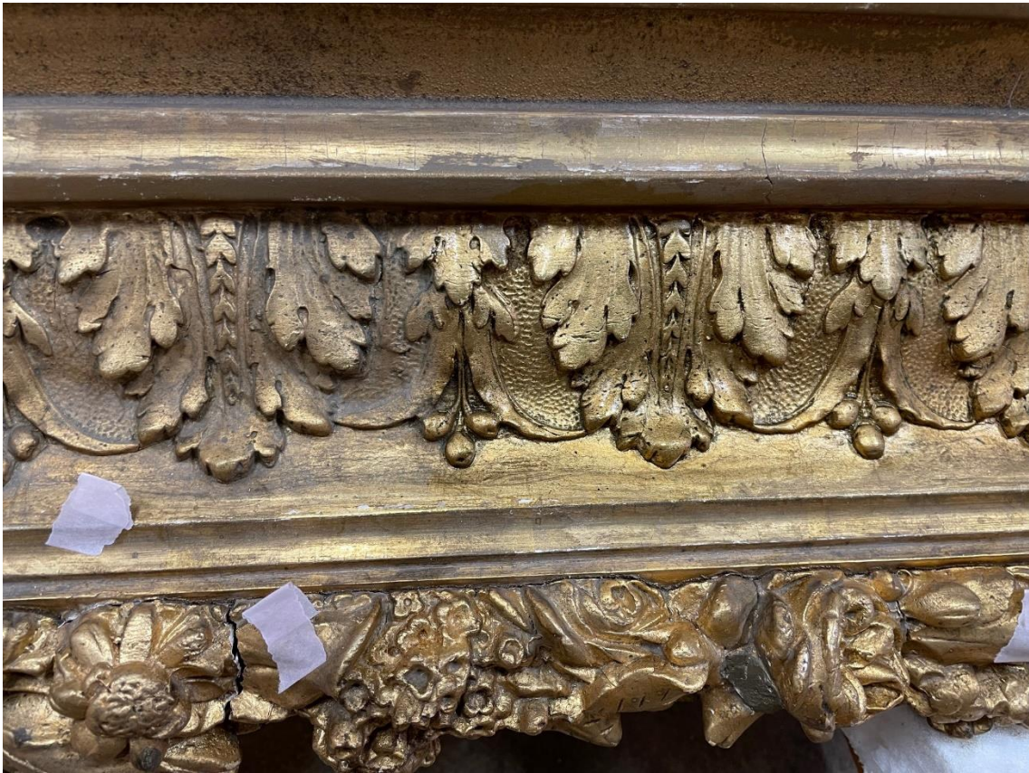
Rengöring av prydnadsram. Lapparna markerar lösa områden.