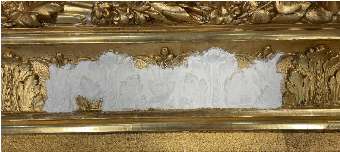
Pastellagerelief på plats.