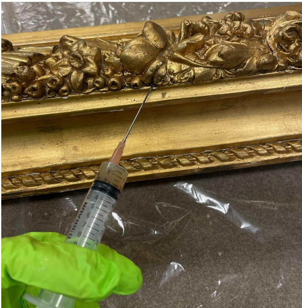
Insprutning av benlim för att stabilisera lösa områden.