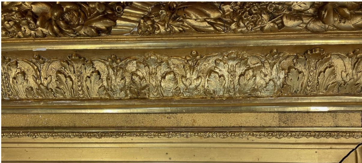
Pastellagerelief förgylld och intonad.