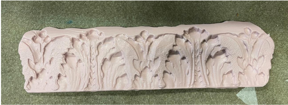
Gjutningsform för pastellage