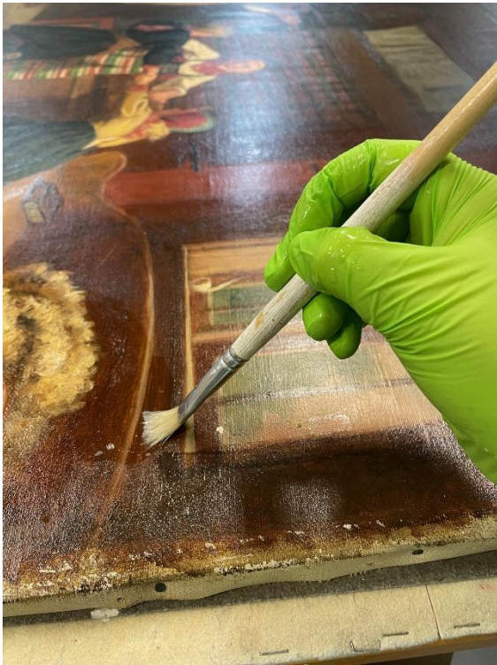
Rengöring med triammoniumcitrat.