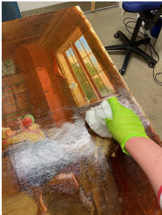
Påförande av ny fernissa.