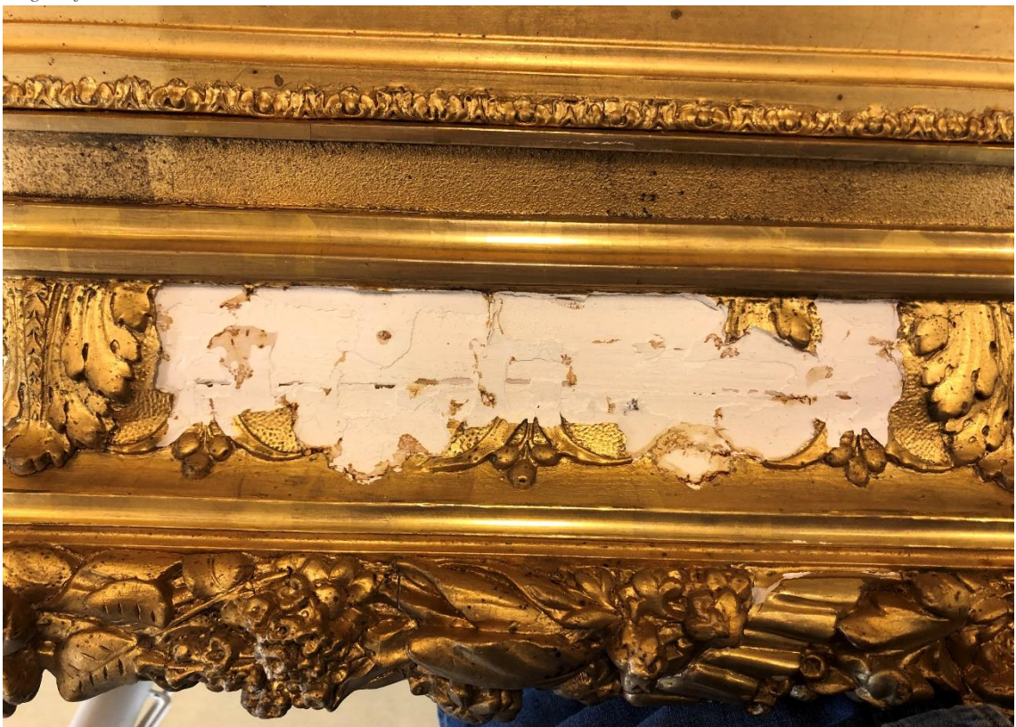
Materialbortfall på ramens ovansida.