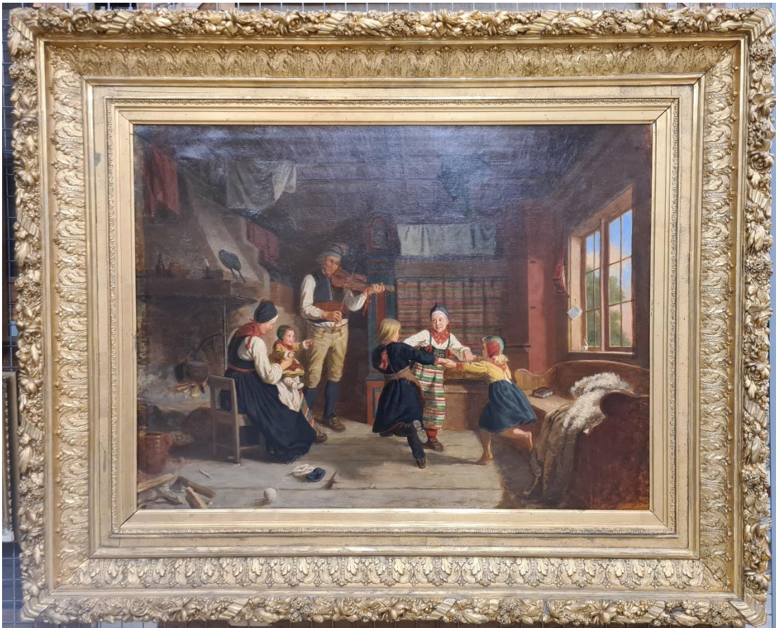
Söndagsafton i en dalstuga (kopia) av A. Jansson, efter konservering.

Skador på grunderingen kittades med pastellage. Dessa, samt andra lakuner och sprickor, retuscherades med akvarell och därefter med hartsfärger. Slutligen fernissades målningen om med dammar löst i terpentin.