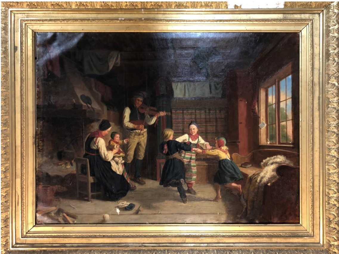
Söndagsafton i en dalstuga (kopia) av A. Jansson, innan konservering.

Duken är ojämn, bucklig och insjunken. Färgytan har flera områden med koncentrerad krackelering. Färgbortfall under och i närheten av ramen, samt en större lakun i närheten av nederkanten, ca 3 x 1,5 cm. Grunderingen i denna är intakt. Finns ett flertal rispor i färgen. Rinnmärken till vänster om mitten av målningen. Två droppar av fernissa eller harts syns vid nedre kanten. Fernissan har mörknat/gulnat, och det finns en ljus fläck till vänster om mössan på barnet i mitten.