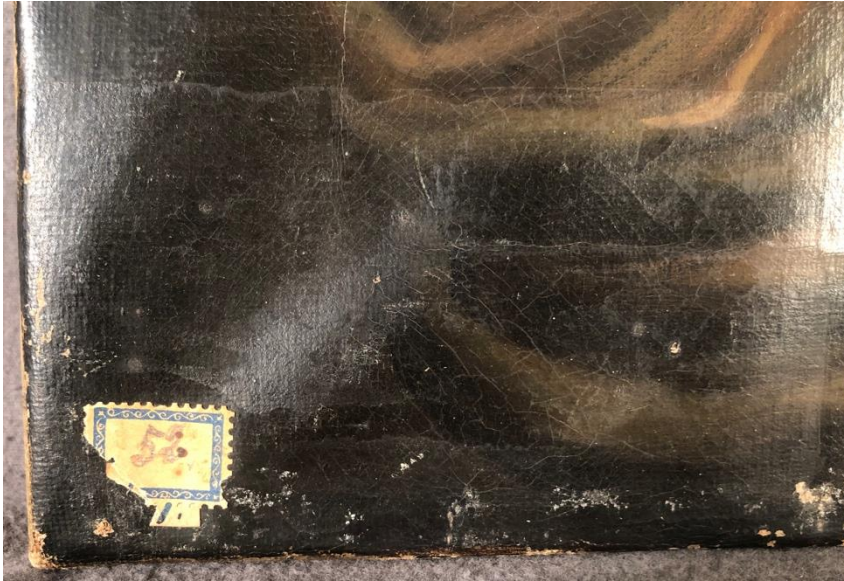
Figur 6: utställningsetikett och färgbortfall i nedre vänstra hörnet