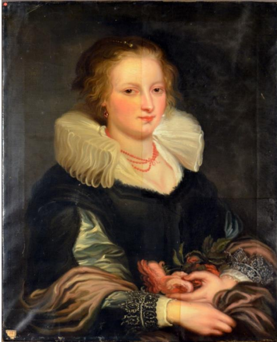
Figur 1: Målningen före konservering