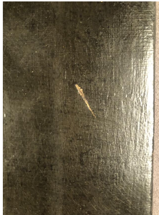
Figur 8: Repa i färglagret vid målningens högra kant.