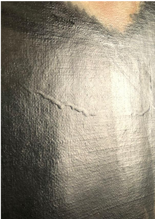
Figur 7: Gammal fernissa som runnit.