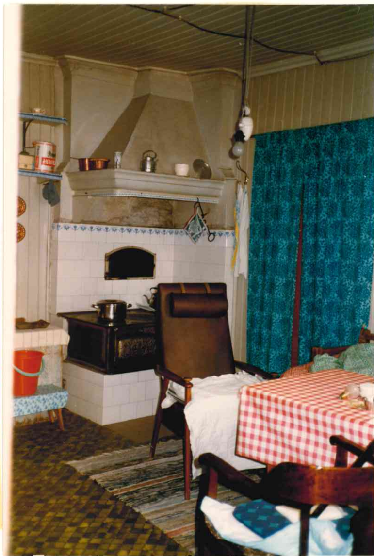
Köket