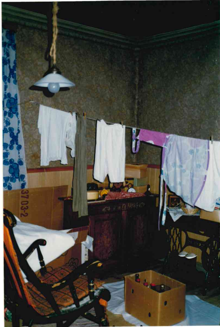
Kammarens innav för köket.