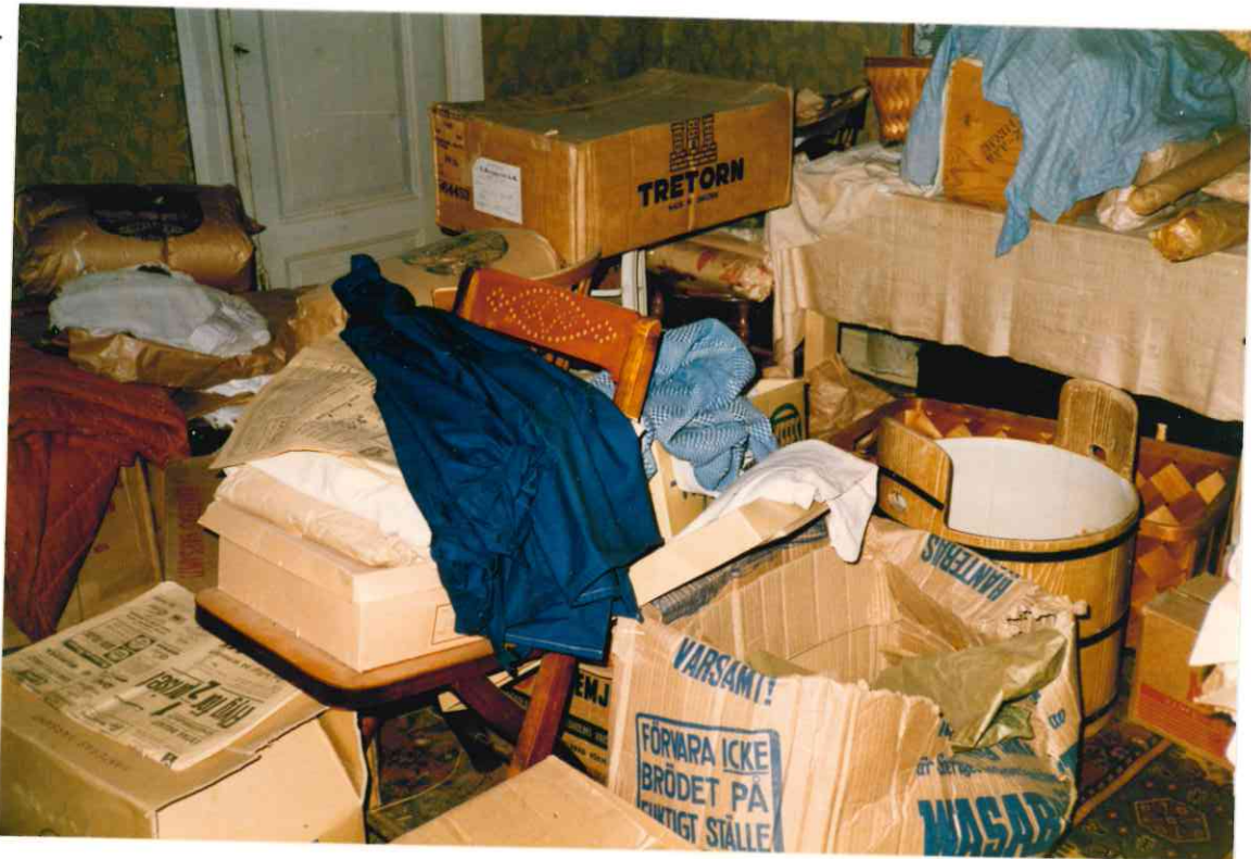
Sovrum på över våningen