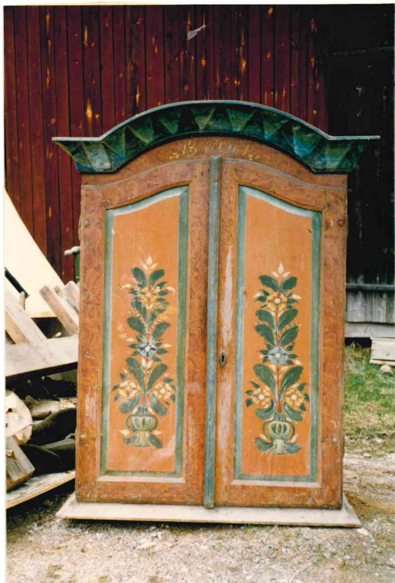
Skåp från uthusen