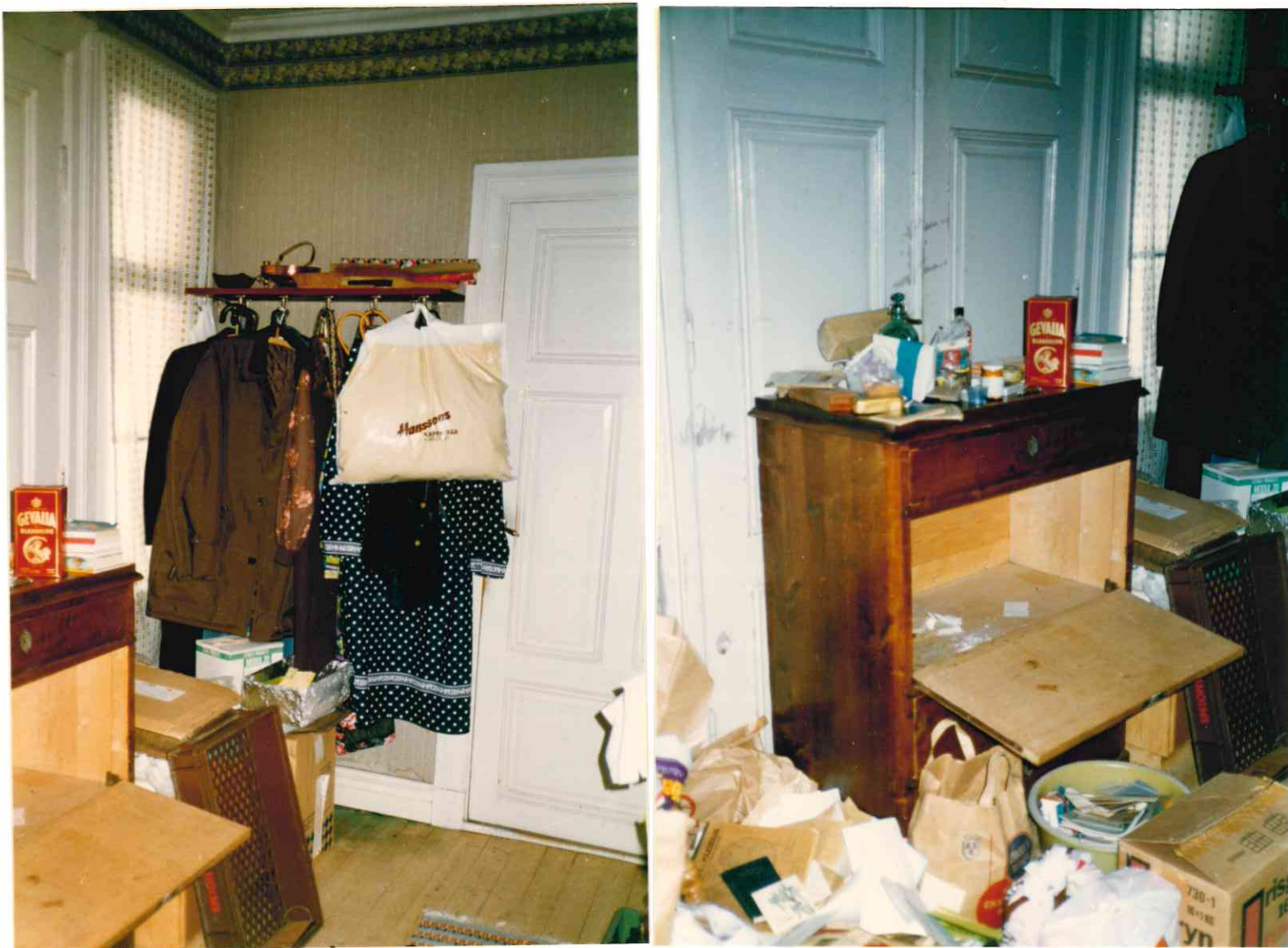
Förstugan