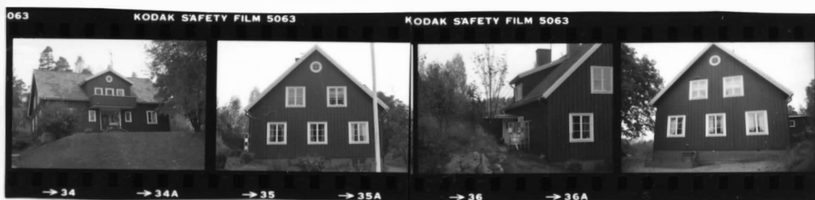
I fr. ö