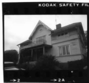
I fr. N Ö