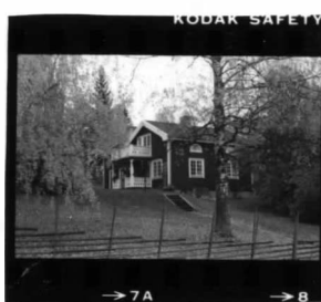
I fr. sv. översikt.