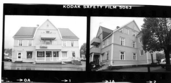
I fr. v.