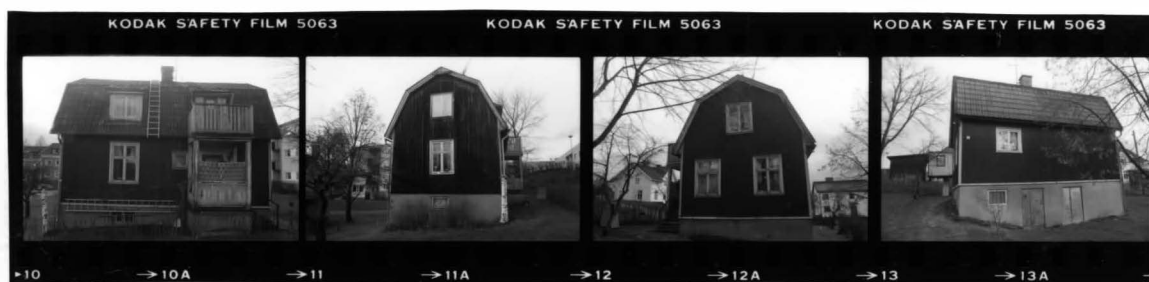
I fr. ö.