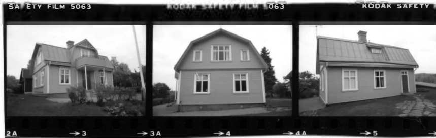
I fr. S. I fr. ö. I fr. n.