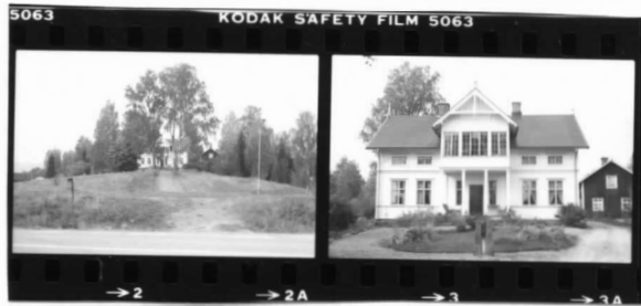
I fr. S. I fr. s. översikt.