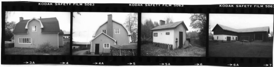
I fr. v. I fr. n. II fr. s.v. III fr. n.