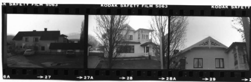
I fr. n o