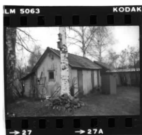
II fr. s.ö.