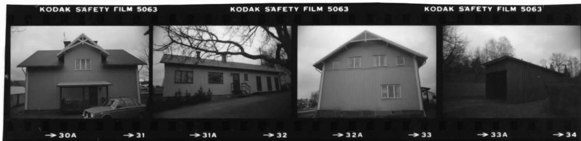
I fr. Ö.