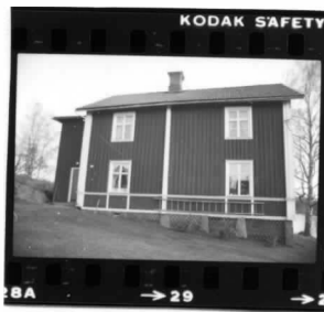
I fr. nv.