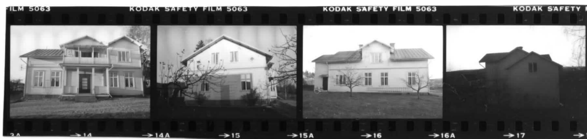
I fr. s.ö. I fr. sv. I fr. nv. I fr. nö