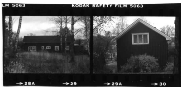
I fr.n. I fr.nö.