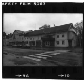
I fr. nv.