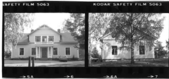
I fr. n. I fr. v.