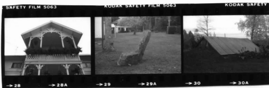
I fr. ö. detalj IV fr. n. V fr. sv.