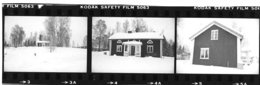
I fr.s. översikt