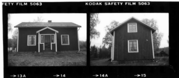
I fr. ö I fr. n.