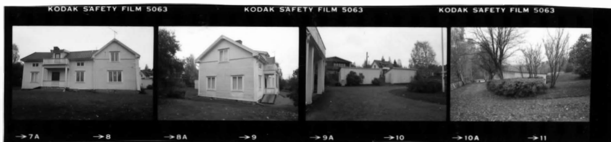
I fr. ö.