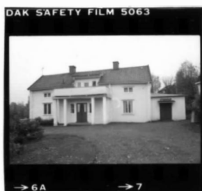
I fr. n.