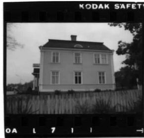
I fr. s.