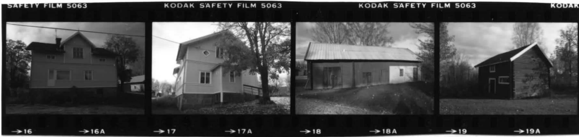
I fr. nö. I fr. n. II fr. s. III fr. sö. IV