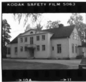
I fr. Ö.