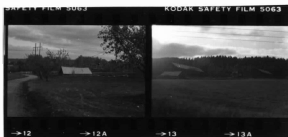
V fr. n. I fr. n. översikt