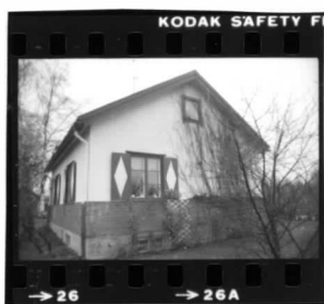
I fr. s.