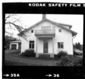
I fr. sö.