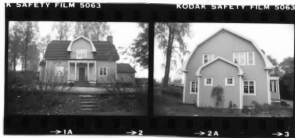
I fr. ö. I fr. s.