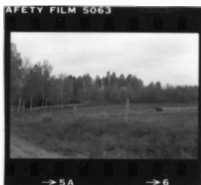
I tr. sö