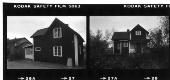
I fr. ö I fr. s.ö.