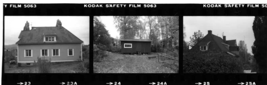
I fr. ö II fr. n. I fr. n. detalj