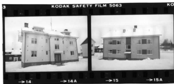
II fr. ö.