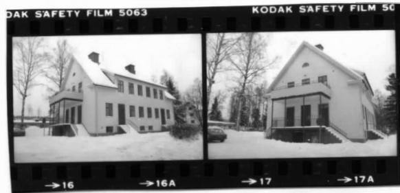
I fr. s. I fr. sv