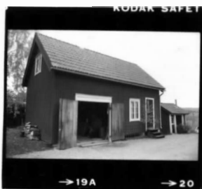
II, III fr. s.