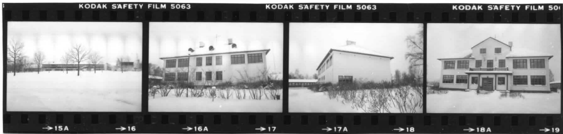
V fr. fr.ö VI fr. nö VI fr. n. VI fr. v.