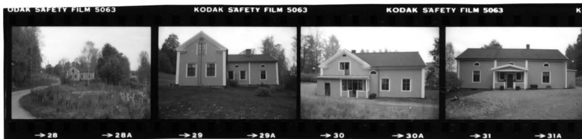
I s. översikt