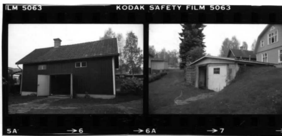
II fr. S. III fr. Sv.