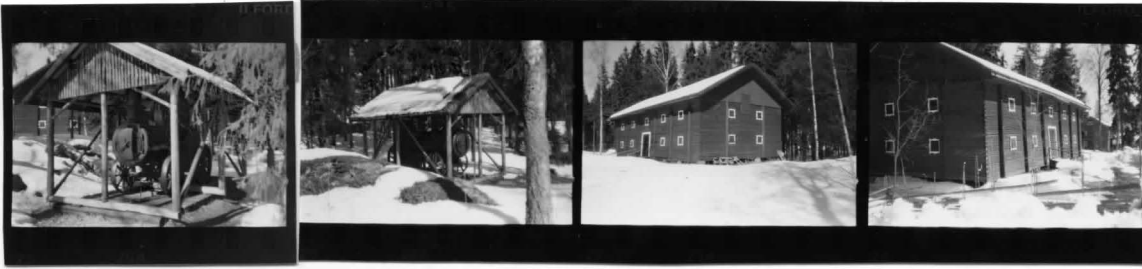
XIII fr SO XIII fr SV XII fr SV XII fr NV