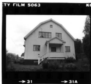
I fr. s.