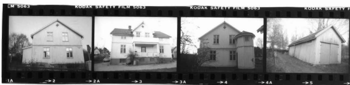
I fr v.