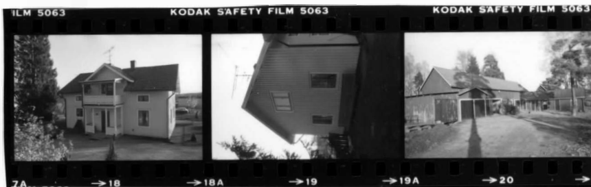
I fr. nv. I fr. n.ö. II fr. ö.