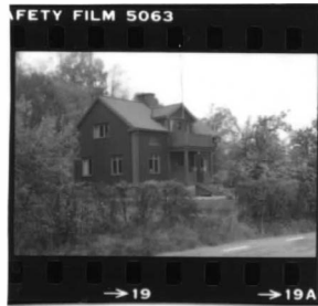
I fr. sö.