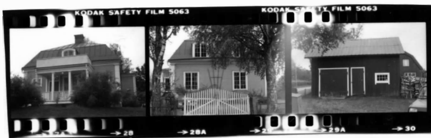
I fr. ö.