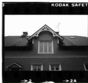
I fr. nv. detalj