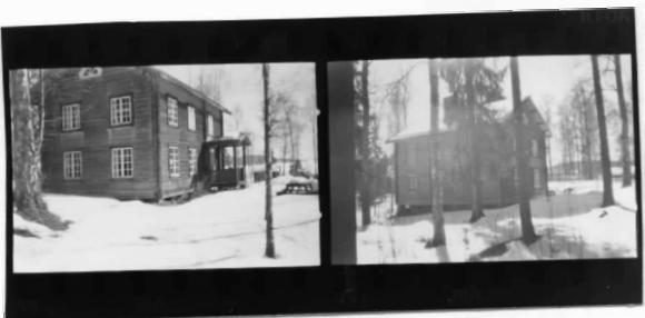
VIII fr NV VIII fr NO