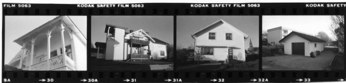
I fr. nv. detalj balkong