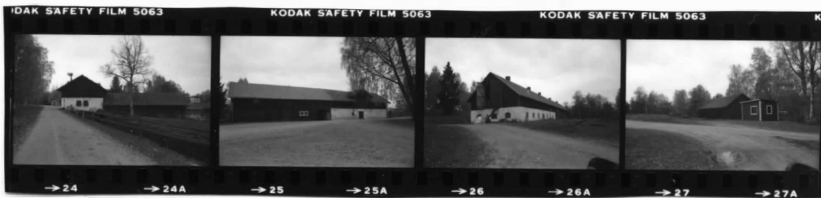
V fr. s o