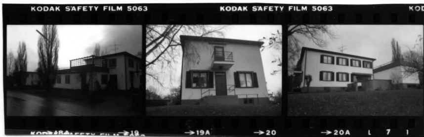
I fr. nō.