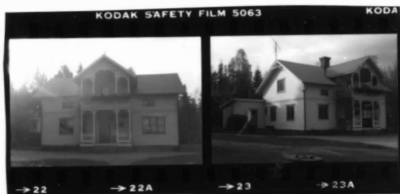
I fr. ö. I fr. sö.