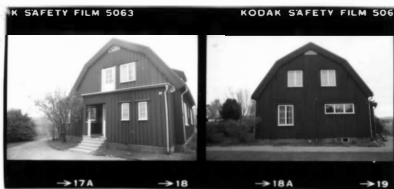
I fr. n.