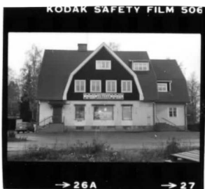
I fr. s.