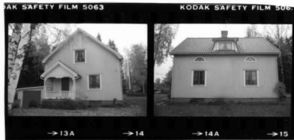
I fr. v I fr. s