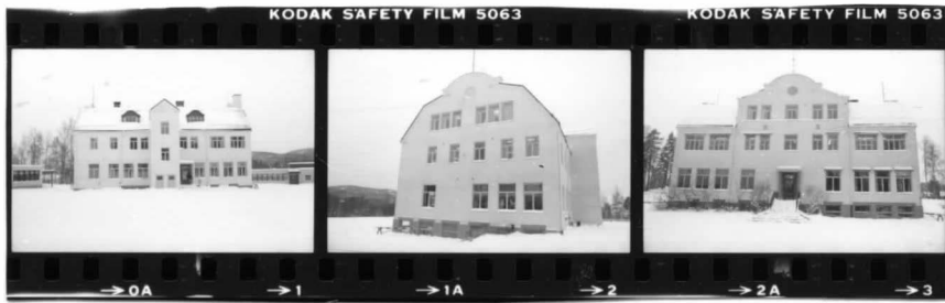
I fr. nv