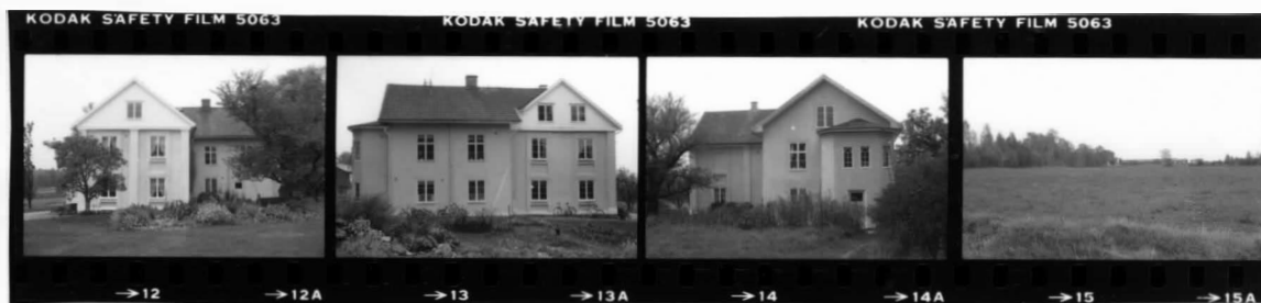
I fr. s.