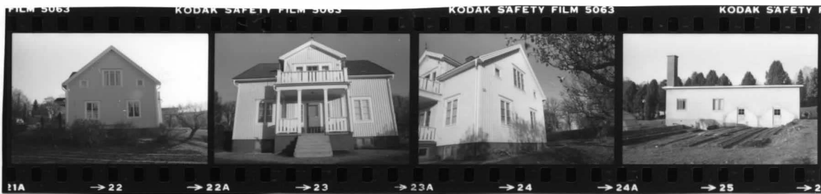
I fr. n.