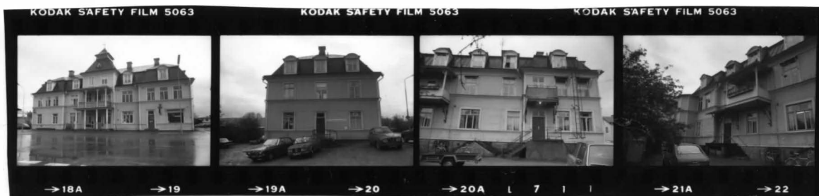
I fr. n.