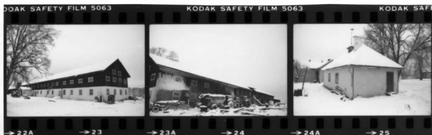
IV fr sv