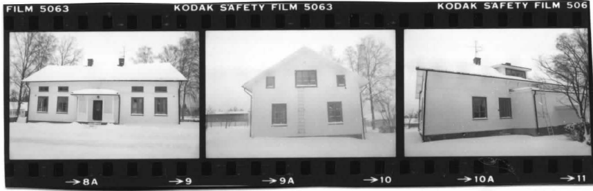
I fr. v. I fr. s. I fr. ö