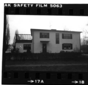
I fr. nō.