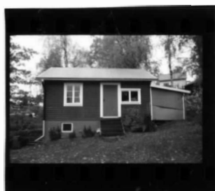
II fr. s.