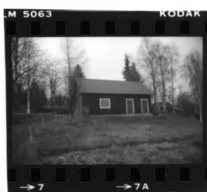
II fr. v.