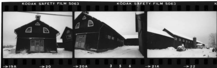
III fr v