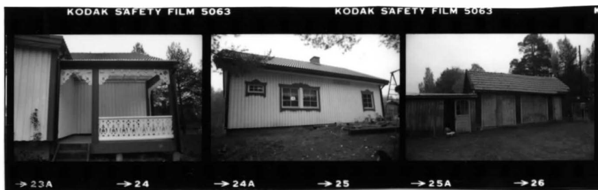
I fr. v. detalj