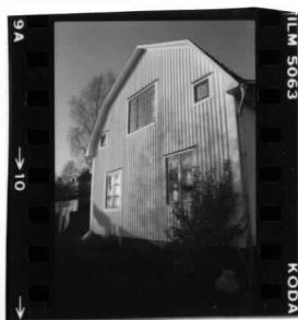
I fr. sö.