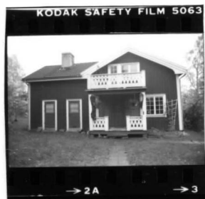
I fr. n.