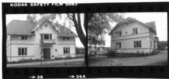
I fr. v I fr. nv.