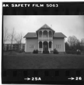
I fr. v.