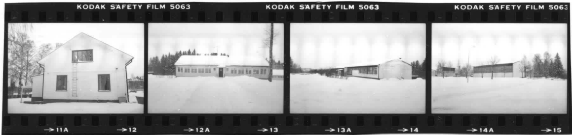
I fr. n. II fr. v III fr. sv. IV fr. ö