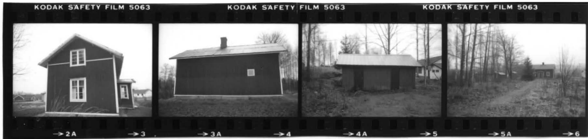
I fr. s.