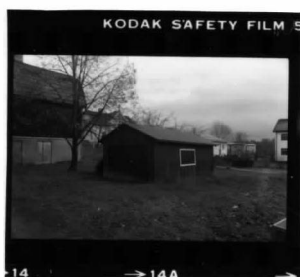
II fr. v.