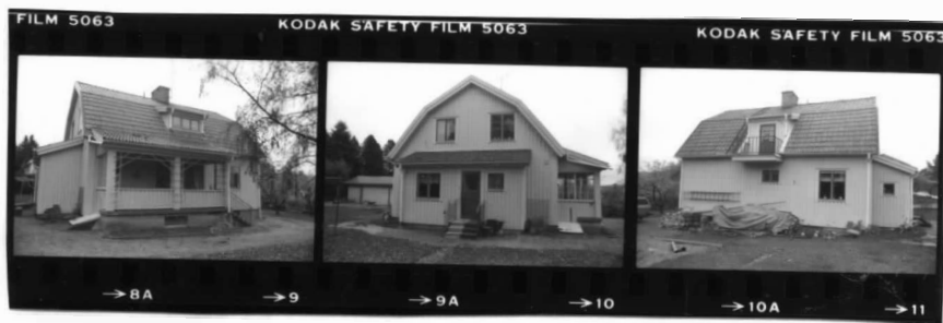
I fr. nv. I fr. n. I fr. ö