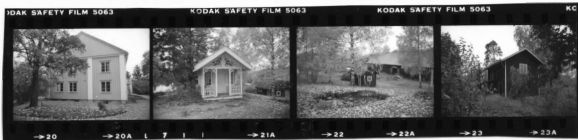
I fr. nv