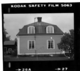
I fr. s.