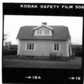
I fr. v.