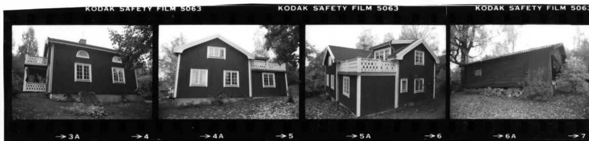
I. fr. v.