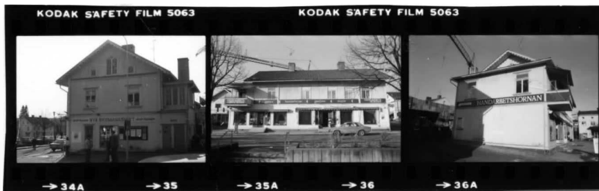
I fr. ö