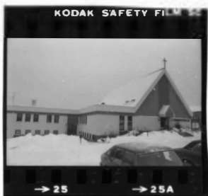
I fr. ð