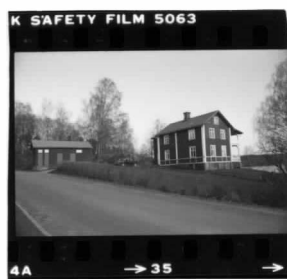
I fr. nv översikt