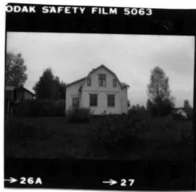
I fr. sv.