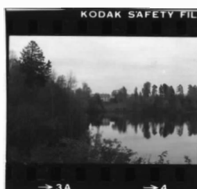
I fr. v. översikt