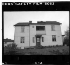
I fr. s.