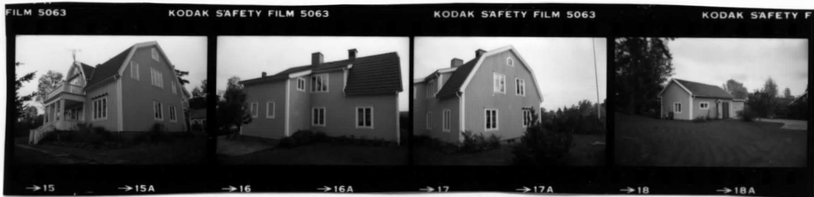
I fr. s.