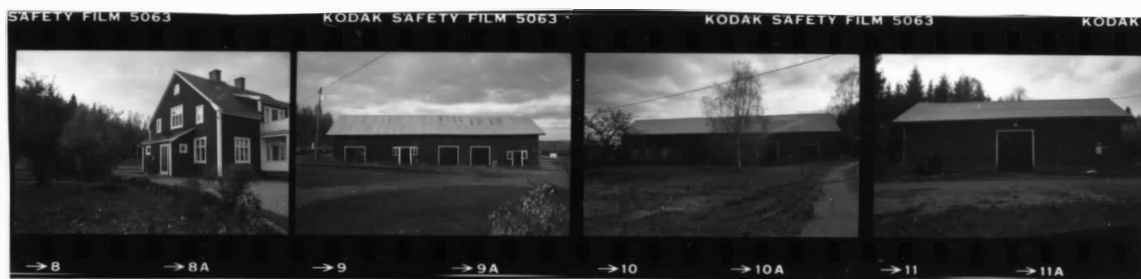
I fr. sö. II fr. s. III fr. n. IV fr. ö.