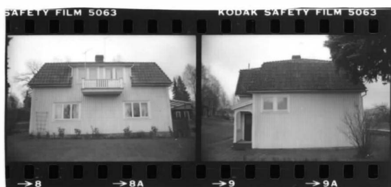
I fr. sv.