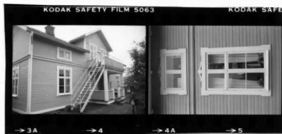
I fr. n.ö. I fr. n. detalj