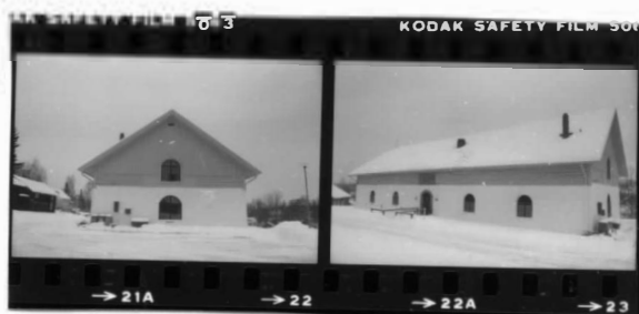
I fr. nv I fr. nö