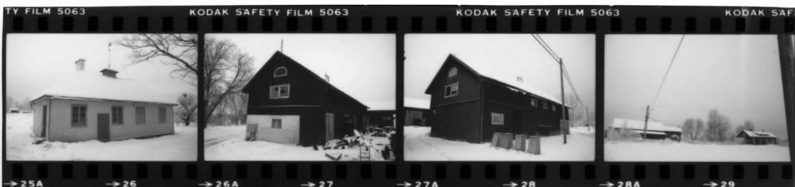
V fr no