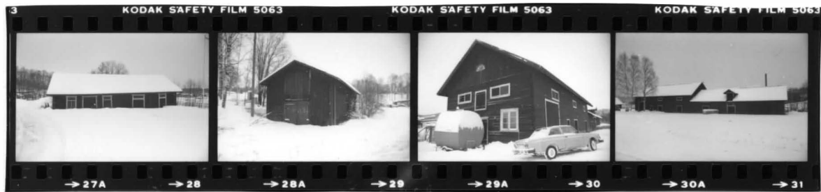
I fr. v