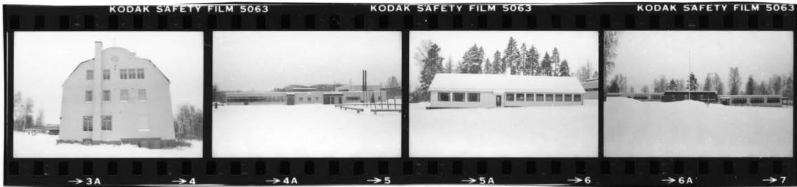
I fr. v.