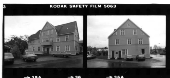
I fr. n.ö