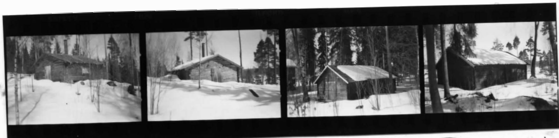
X fr SV X fr NO XI fr SO XI fr NV