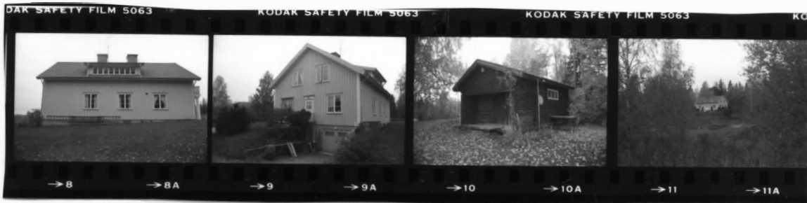
I fr. nv I fr n o II fr. s o I fr s. översikt