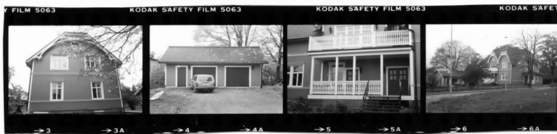
I fr. v.