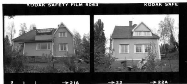
I fr. v I fr. s.