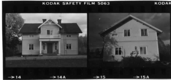
I fr. v. I fr. sö.