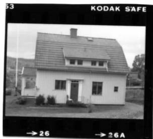
I fr. n o .