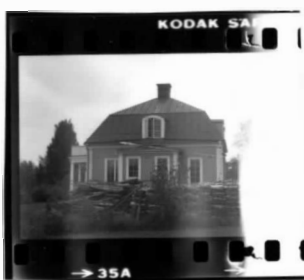
I fr. n.