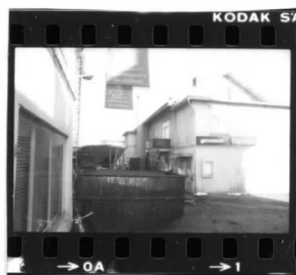
I fr. nv