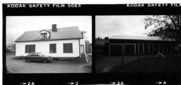
II fr. v.