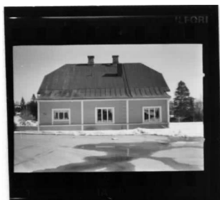
I fr. V