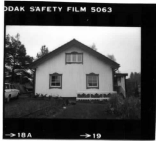
I fr. n.