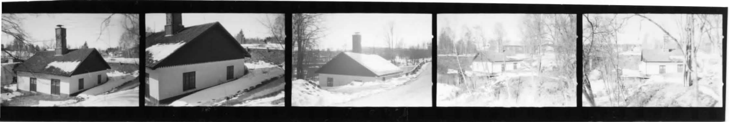
I fr SO