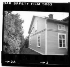
I fr. n.ö.