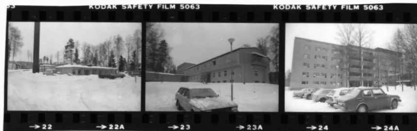
VI fr. sö VII fr. sv. VIII fr. sv