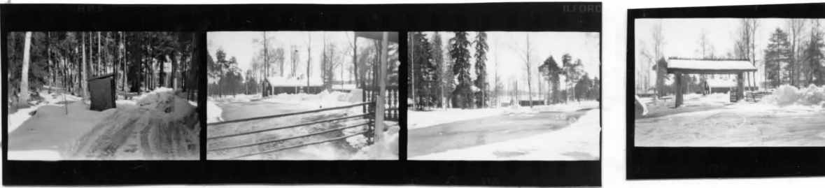
XIV fr V Översikt fr NO fr NV fr N