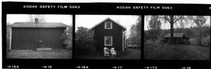
I fr. v. I fr. s. II fr. ö.