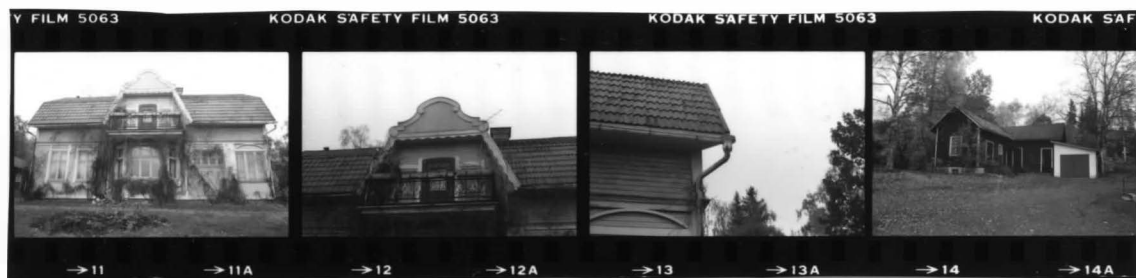
I fr. v