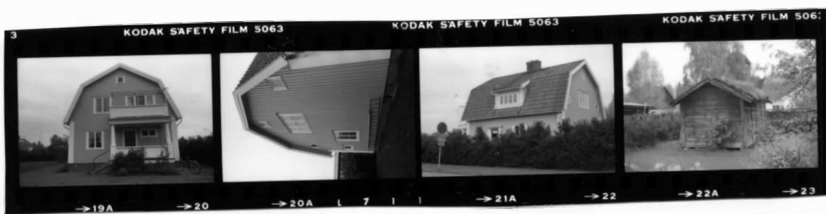
I fr. s.