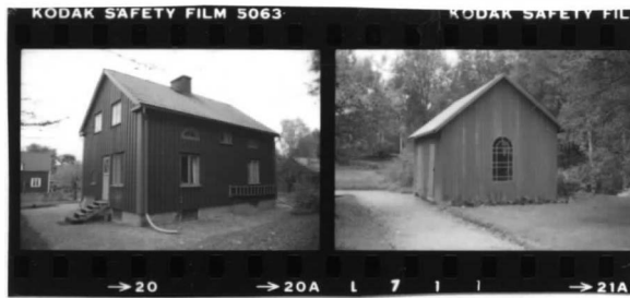
I fr. nv. II fr. n.