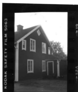
I fr. No.