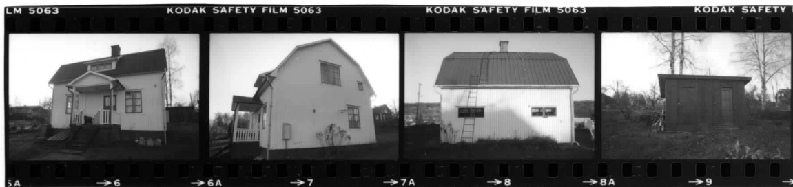
I fr. ö.