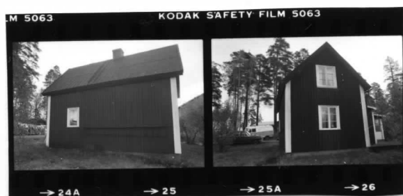
I fr. nv. I fr. v.