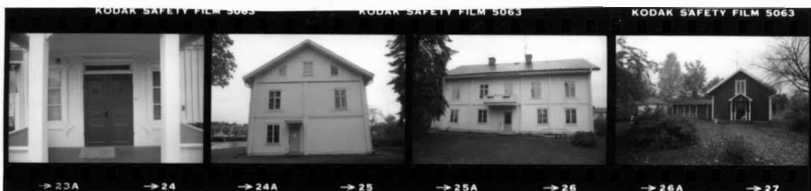
I fr. nv detalj I fr. v. I fr. s. II fr. ö