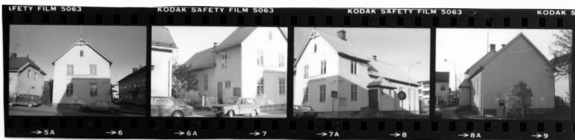
I fr. v