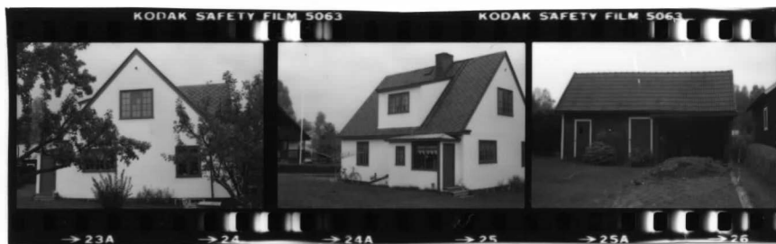
I fr. s. I fr. sv. II fr. 0