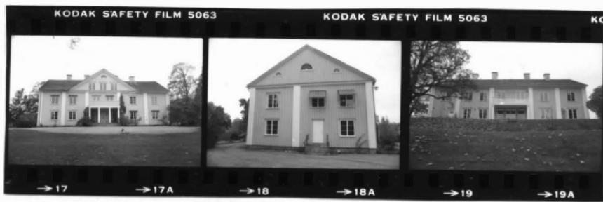
I fr. n o .