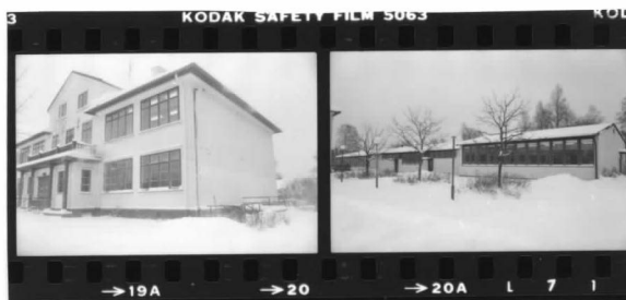
VI fr. sv VII fr. sö.