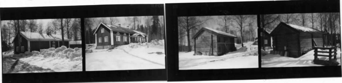
I fr N I fr S II fr SO II fr NV