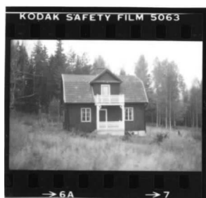
I fr. s.