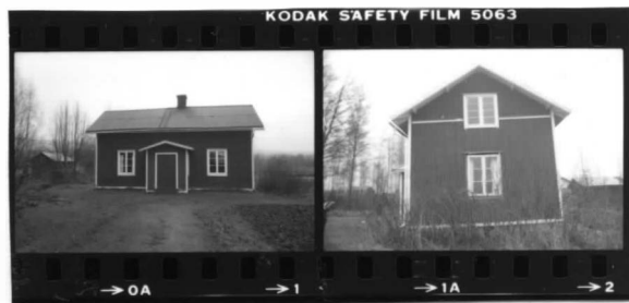
I fr. ö.