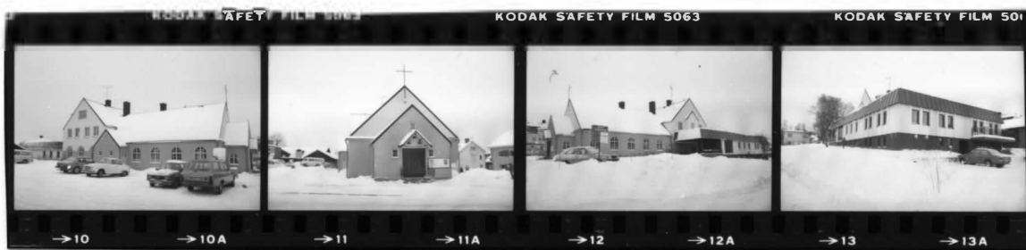
I fr. n.v.