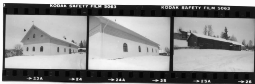
I fr. sö I fr. sv II fr. nv.