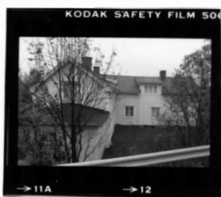
I fr. sv.