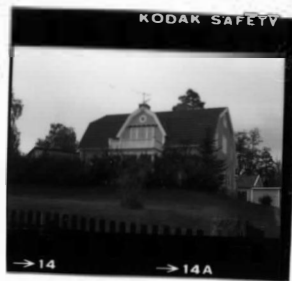
I fr. sv.