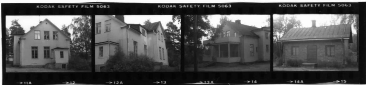
I fr. Sv.