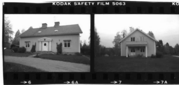
I fr. s. I fr. v