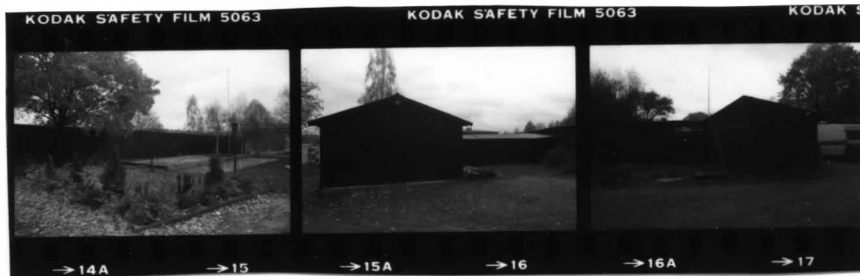
II fr. nv.