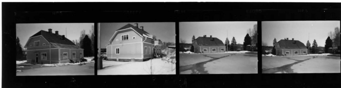
I fr NV