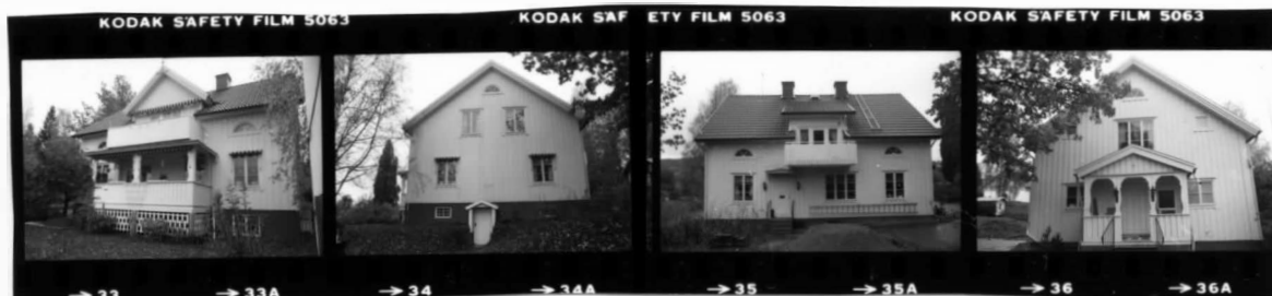
I fr. sv