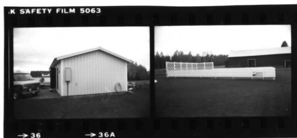
II fr. v