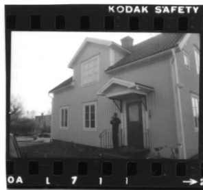
I fr. nö.