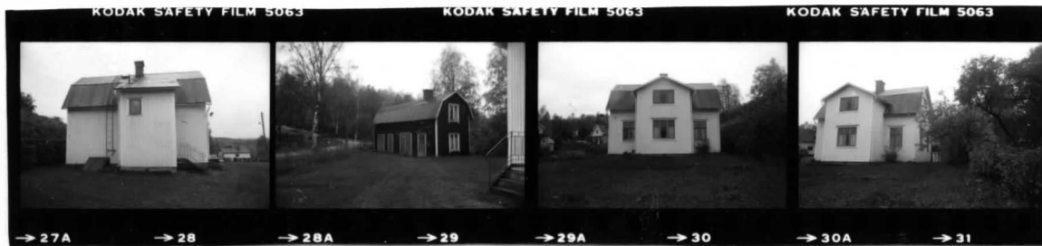
I fr. v.