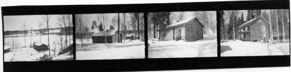
VI fr NO VII fr NV VII fr SO VIII fr SV