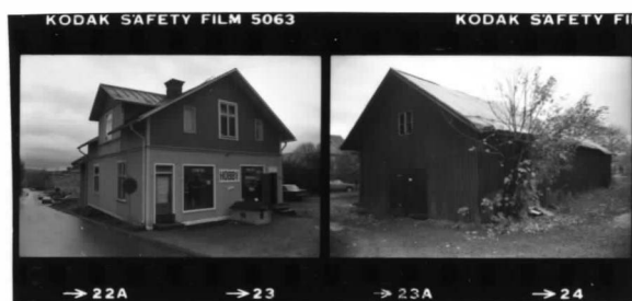
II fr. n.