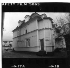
I fr. s.