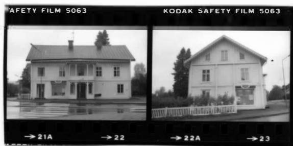
I fr. nv. I fr. ö