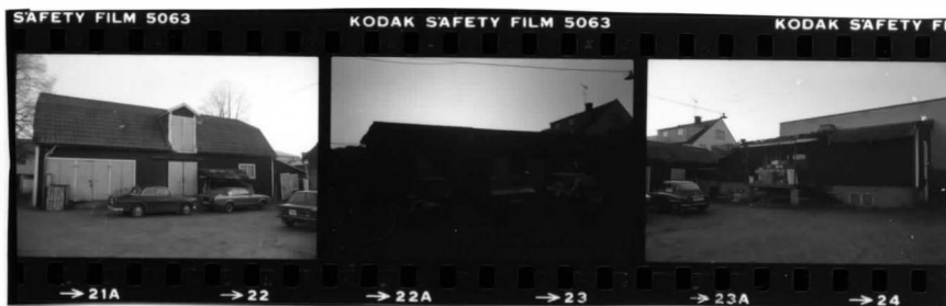
II fr nv