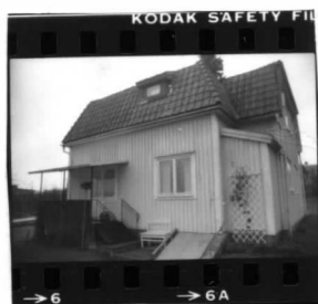
I fr. s o .