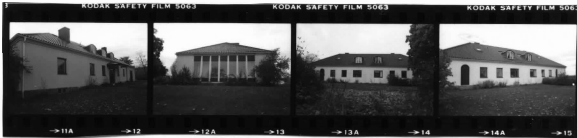
I fr. n. I fr. n o . I fr. sv. I fr. s.