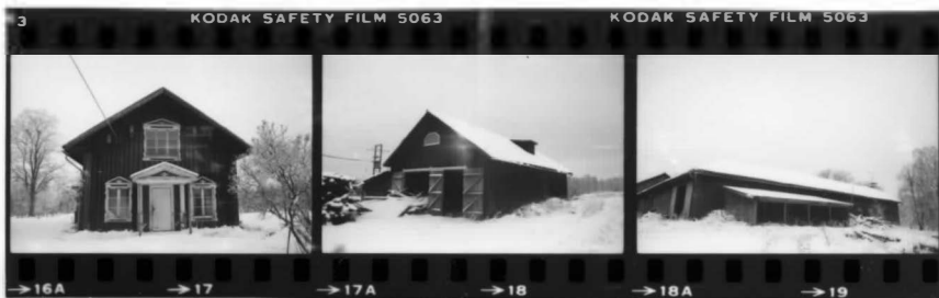
I fr ö