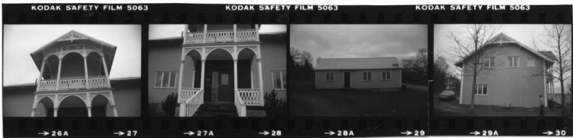
I fr. v. detalj