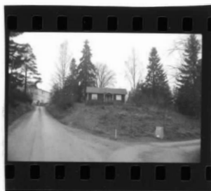
I fr.s. översikt