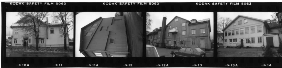
I fr. v.