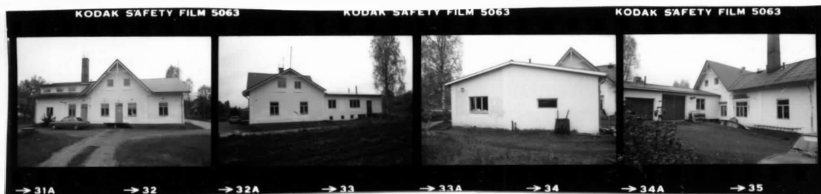
I fr. ö