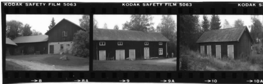
III fr. v. IV fr. v. V fr. sv.