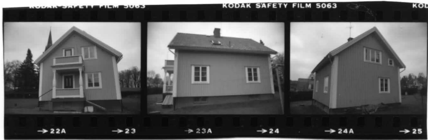
I fr. nv.