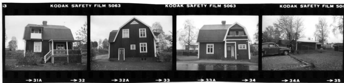
I fr. s.