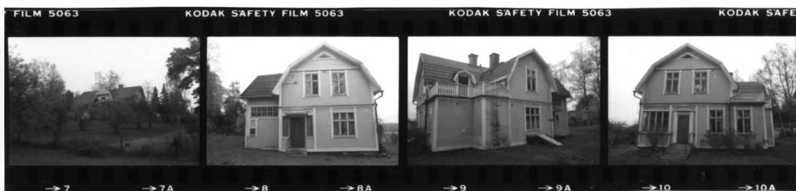
I fr. sv. översikt.