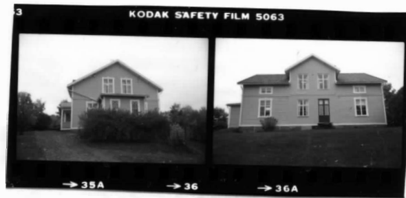
I fr. ö. I fr. s.