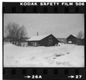
I fr. n