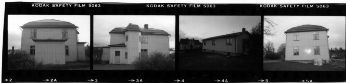
I fr. ö.