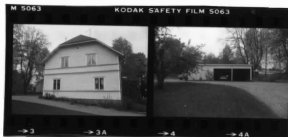
I fr. s. II fr. sö.