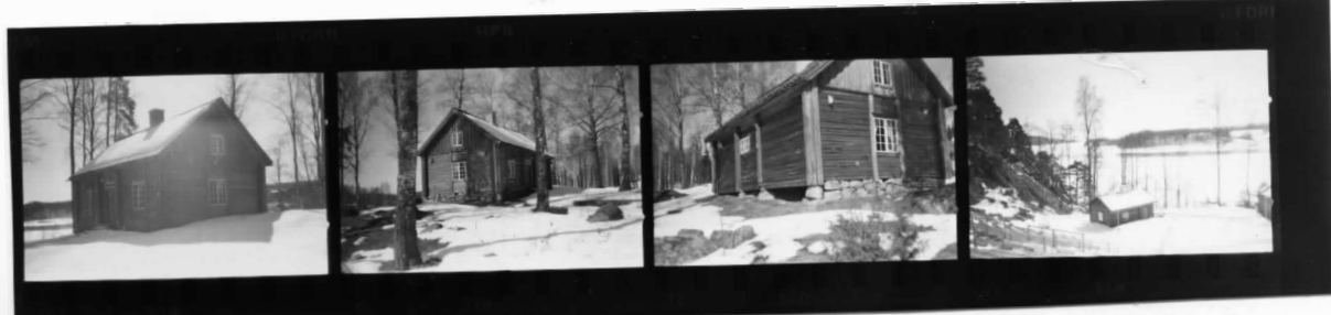
III fr NO III SO III SV V fr NV