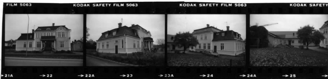
I fr. v.