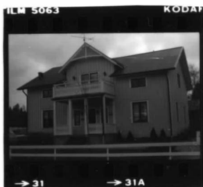
I fr. Ö.