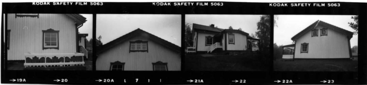
I fr. n. detalj