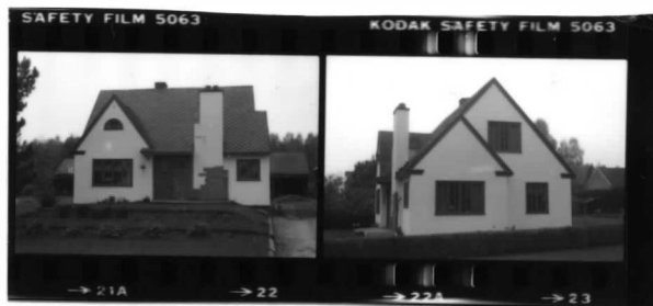
I fr. 0 I fr. n.