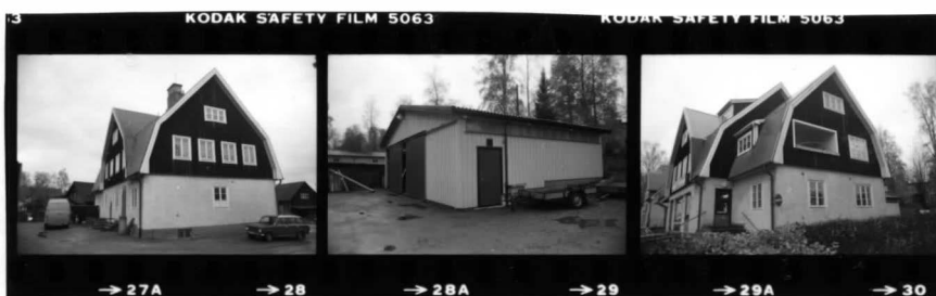
I fr. nv.