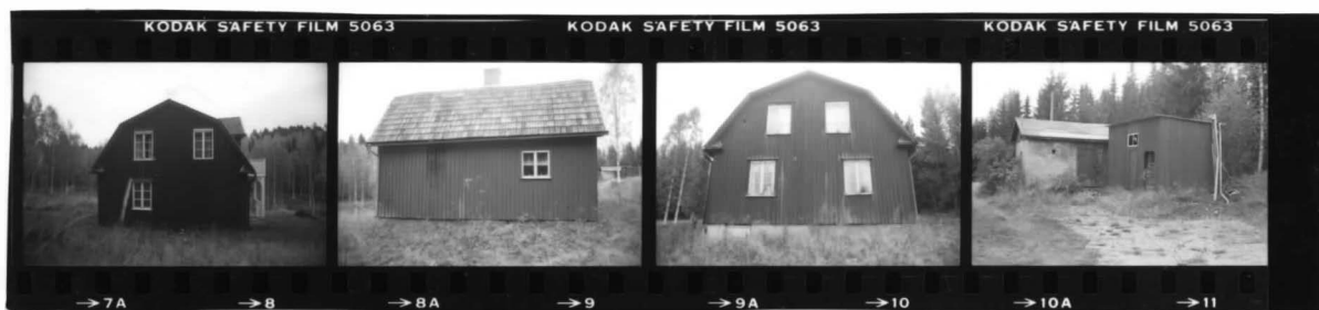
I fr. v.