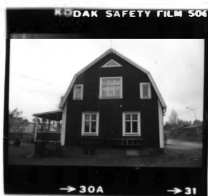
I fr. ö.