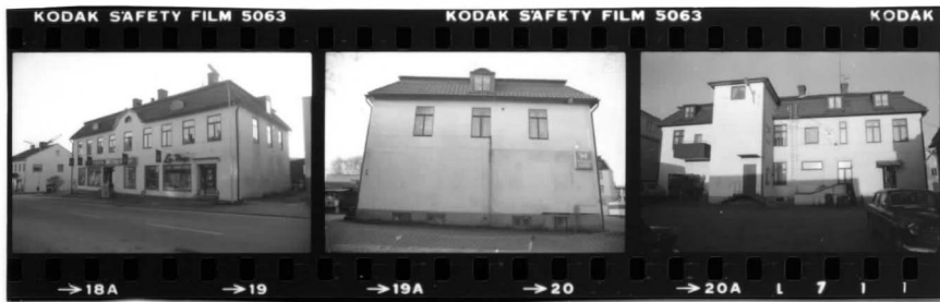
I fr. ö.