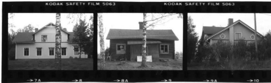
I fr. s. II fr. v. I fr. ö