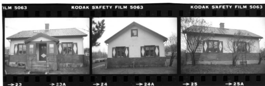
I fr. ö.