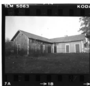
II fr. s.