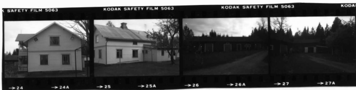
I fr. nv. I fr. v. II fr. n. III fr. ö.