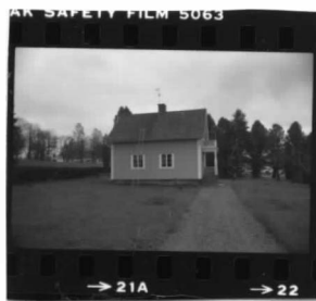
I fr. n.