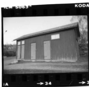
II fr. v.