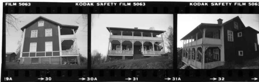
I fr. sv.