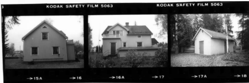
I fr. 8 I fr. n. II fr. sö