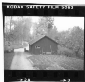
II fr. v.