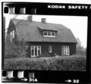
I fr. v.