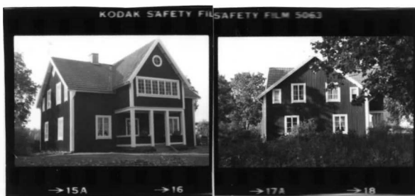
I fr. v

Fryksände sn. Torsby 1:13 Åsen (Hallstensgården)