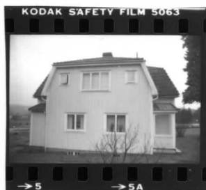
I fr. n o .