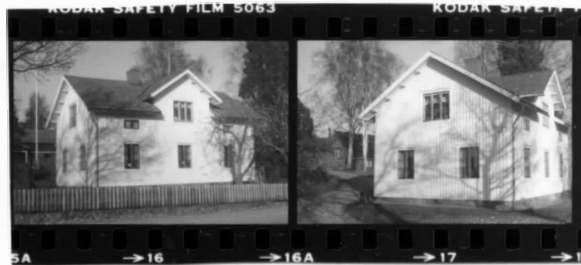
I fr. s. I fr. sv.