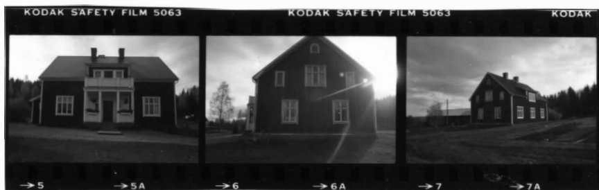
I fr. n. I fr. nv. I fr. nv.