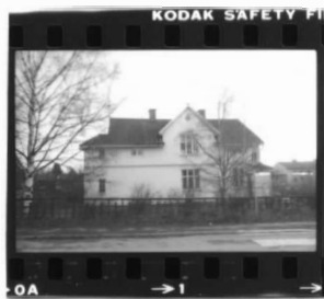
I fr. n.