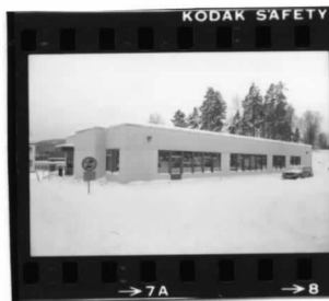
V fr. n.