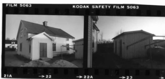
I fr.nv. II fr.n.