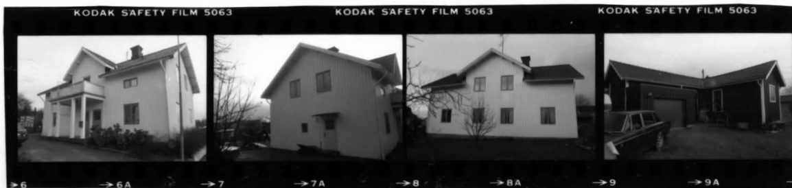
I fr. nv.