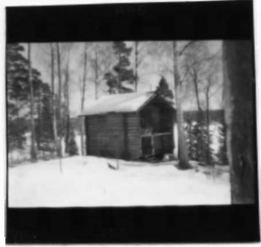
IX fr NV