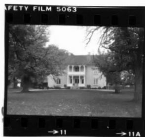
I fr. v.