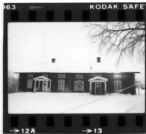
I fr s

TORSBY kn, Fryksände sn, Stensgård 1:220