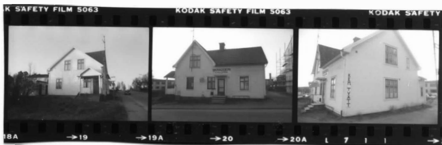
I fr.s. I fr.ø. I fr.n.