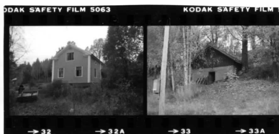
I fr. ö