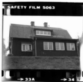
I fr. ö.