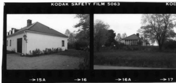
I fr. nv. I fr. n o . översikt