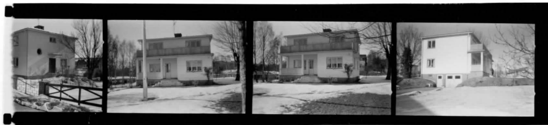
I fr NO I fr S I fr SO I fr SV