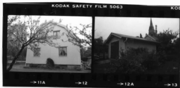
I fr. s. II fr. s.