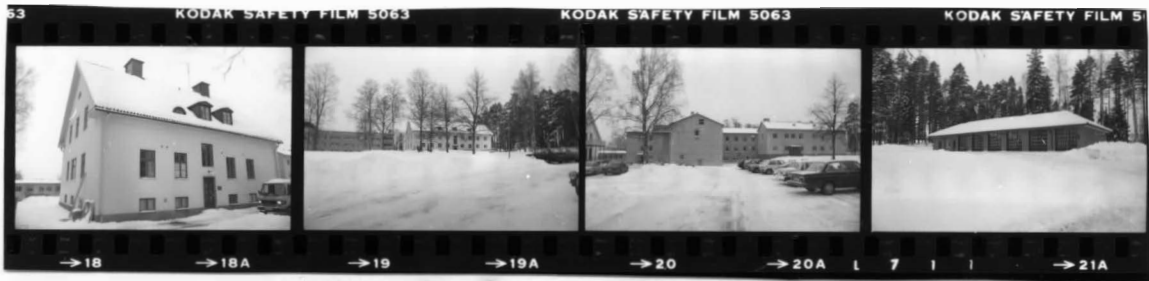
I fr. n. III fr. ö IV fr. nv V fr. ö.