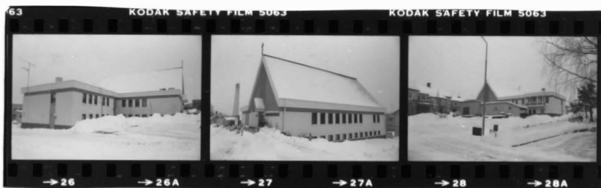
I fr. sð