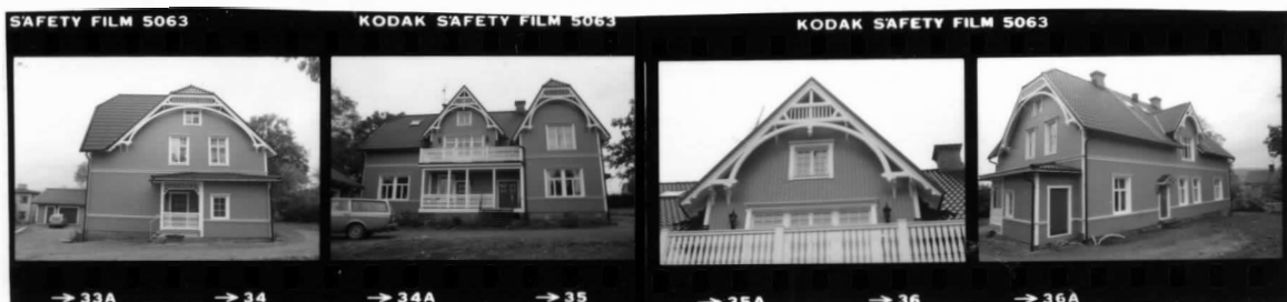
I fr. ö.