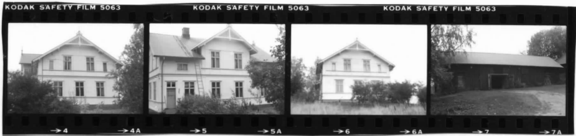
I fr. ö. I fr. n. I fr. v. II fr. ö.