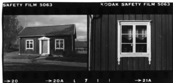
III fr. s. IV fr. s. II detalj