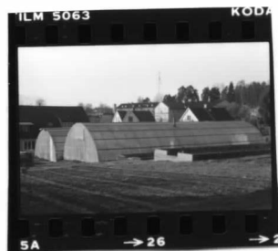
III fr. ö.