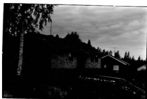
→ 23A ← 24