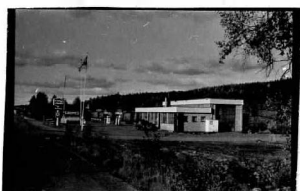
→ 24 KODAR 24A5TV