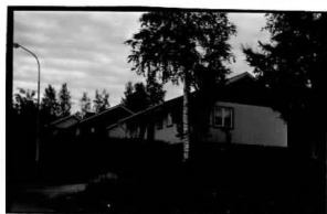
→ 22A ← 23