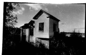
→ 30 → 30A