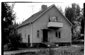
→ 11A → 12