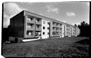
26 → 26A →

Kv. Ugglan, Stg 48 H, Stiftelsevägen 15,17,19,21.