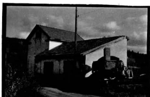
→ 28 → 28A