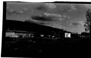
→ 27 → 27A

Kv. Sågen, Stg 85, Bergslagsgatan 88-98.