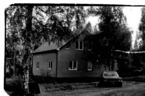
→ 12A → 13