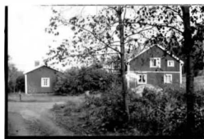
I,II S översikt