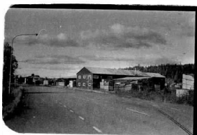
→ 25 → 25A

Kv. Sågen, Stg 85, Bergslagsgatan 88-98.