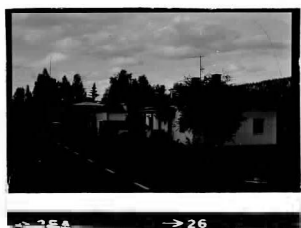
Miljöbild fr. S