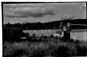
→ 26 → 26A

Kv. Sågen, Stg 85, Bergslagsgatan 88-98.