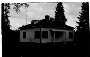
→ 9A → 10