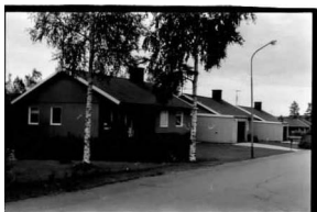
→ 21A ← 22