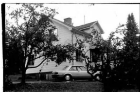
→ 10A → 11