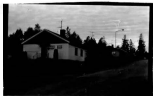
→ 20A ← 27