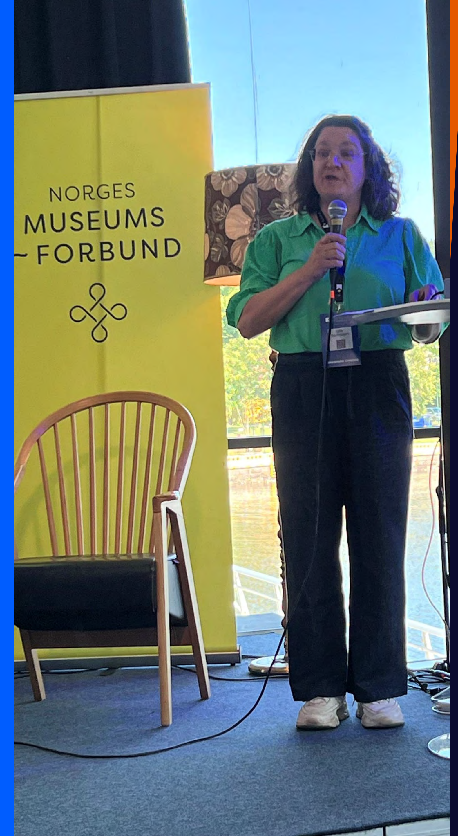
Foto: Innlegg på Kulturytring 2025

Vi tar del i samfunnets digitale transformasjon. Det innebærer at vi tilbyr formidling, forskning og kunnskapsutvikling på digitale plattformer.