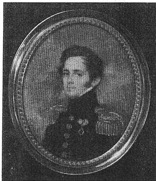
Fig. 3. Ulric Croneborg. Miniaturporträtt som vidstående.

jen von Gey- müllers slott med Betty von en liten flicka i en målning