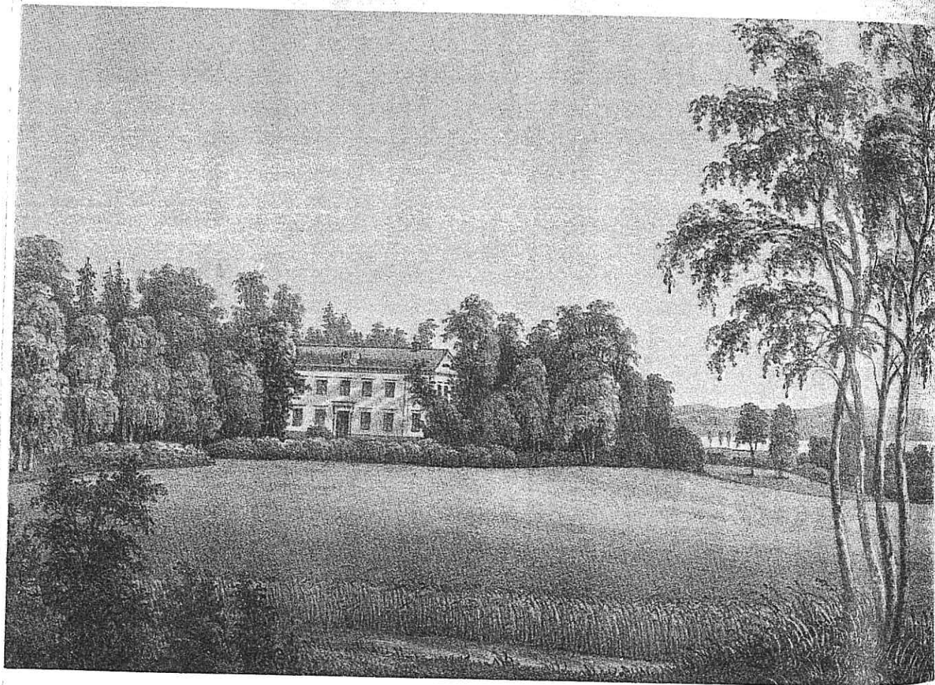
Fig. 4. Östanås. Litografi av Thora Thersner i "Utsigter från Wermland", 1863–67.

Den ståtliga herrgården Östanås är nu sedan länge borta. Äldre foton visar emellertid att den var av den vanliga värmländska typen: en timrad byggnad i två våningar med skiffertak, profilerade fönsteromfattningar och här också deko-