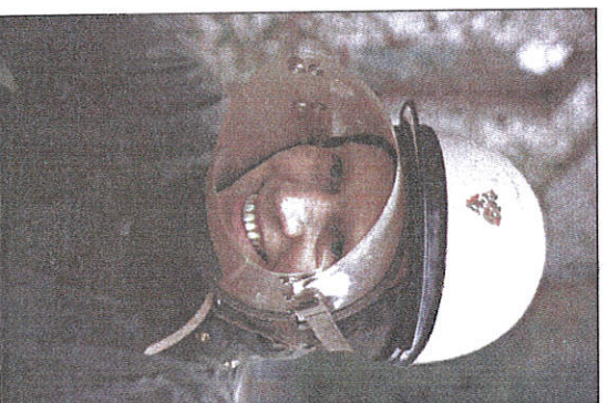
TIDSRIKTIG: Utstyret må vere tidsriktig, denne forløparen til køyrebrillene fann Dahl på ein marknad.

– Eg er oppfått av å ha det i mest mogleg original tilstand, og har fått tak i ein DBS herre-