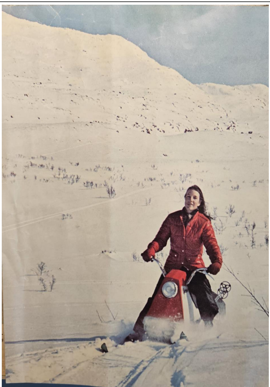
Nedtecknat av Agneta Knutas 2024