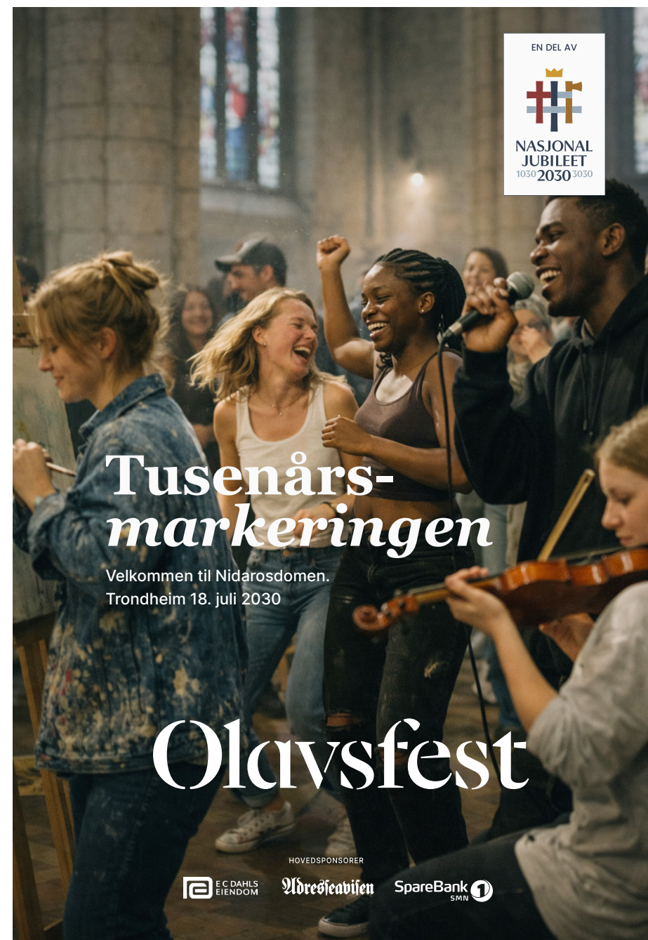
Eksempel 1_ NJ2030 partnerlogo_vertikal

Eksempelene viser prinsipper for bruk og plassering av partnerlogo og kombinasjonseblem. Løsningen skal alltid sikre tydelige avsenderforhold og en klar tilknytning til Nasjonaljubileet 2030.