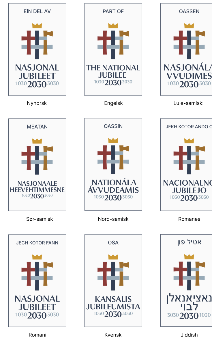
NJ2030 partnerlogo_(flere språkformer)