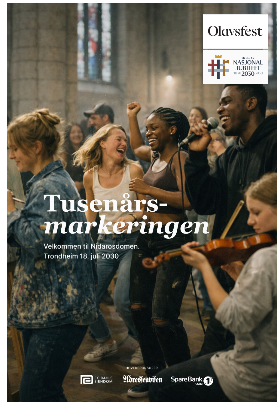
Eksempel 2_ NJ2030 komb.emblem_A