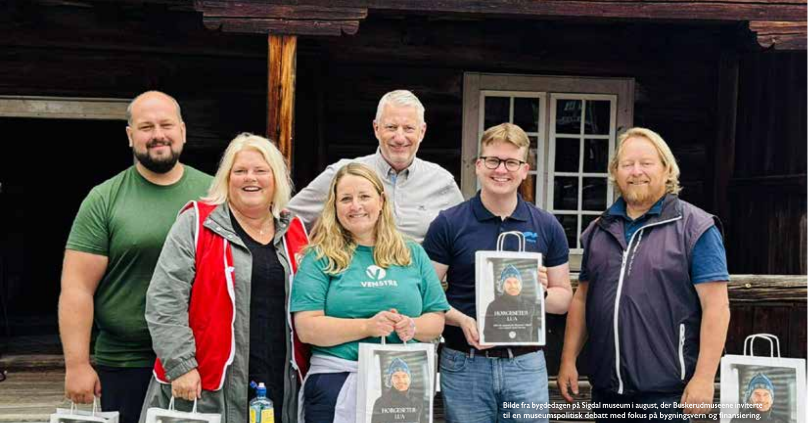
Bilde fra byggedagen på Sigdal museum i august, der Buskerudmuseene inviterer til en museumspolitisk debatt med fokus på bygningsvern og finansiering.