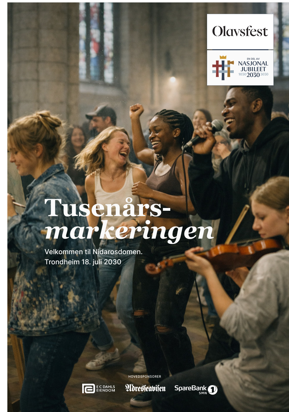
Eksempel 2_ NJ2030 komb.emblem_A