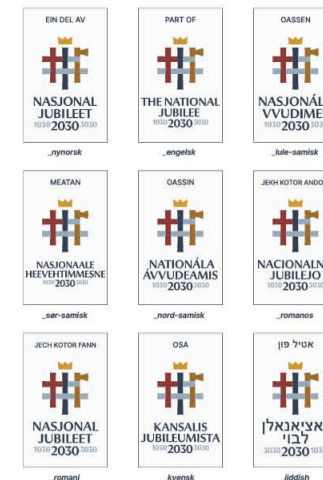
NJ2030 emblem_(flere språkformer)

Det finnes i to varianter. Valg av variant bør baseres på logoens proporsjoner, slik at uttrykket fremstår balansert og konsistent på tvers av flater og bruksområder.