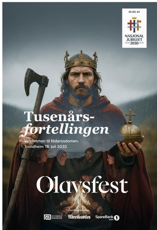
Eksempel 1_ NJ2030 emblem_vertikal

Eksempelene viser prinsipper for bruk og plassering av emblem og kombinasjonseblem. Løsningen skal alltid sikre tydelige avsenderforhold og en klar tilknytning til Nasjonaljubileet 2030.