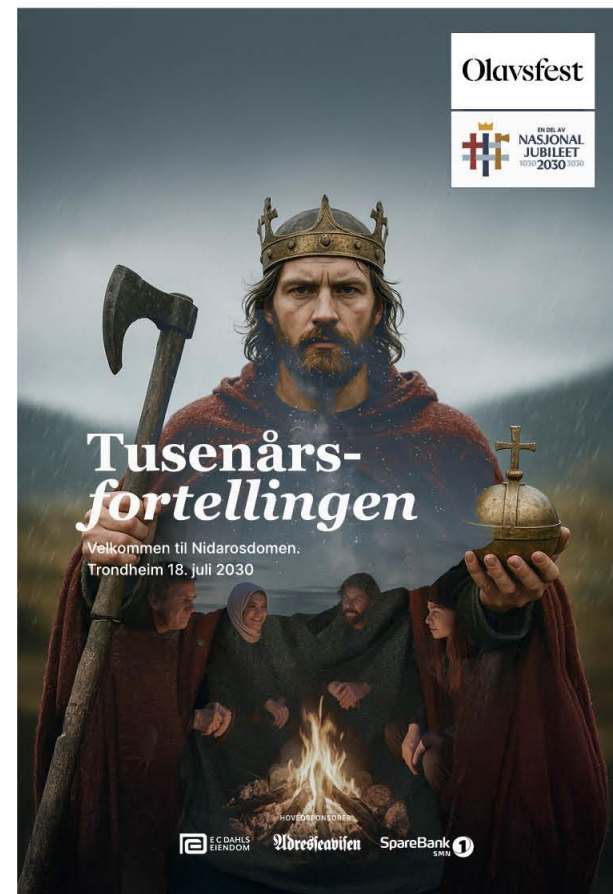
Eksempel 2_ NJ2030 komb.emblem_A