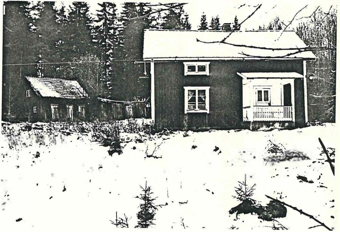
Abrahamsmyra Ablomsmyren Rudsheden 1:26