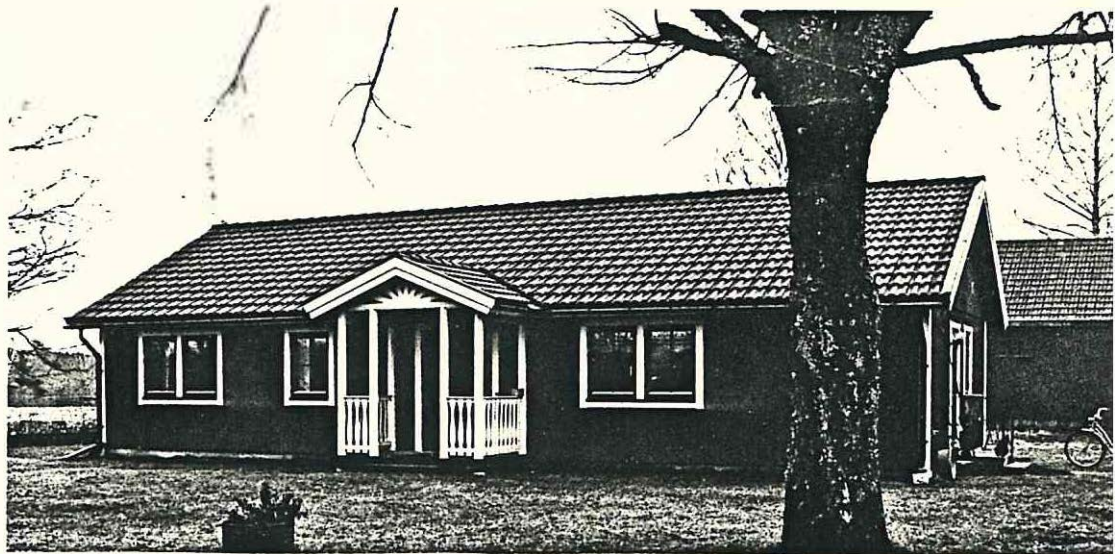
Nya stugan byggd på 1980-talet