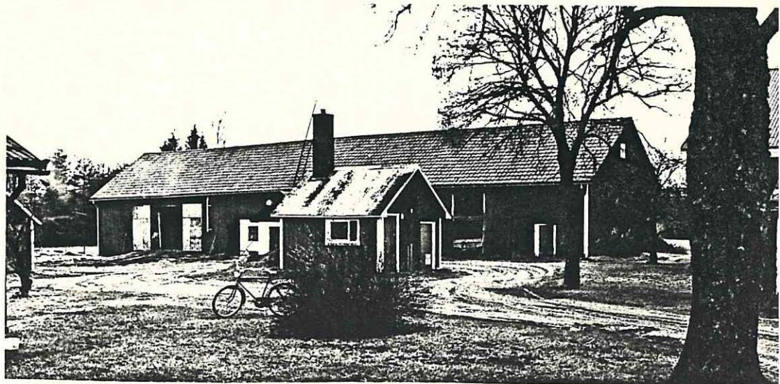
uthus med Ladugård