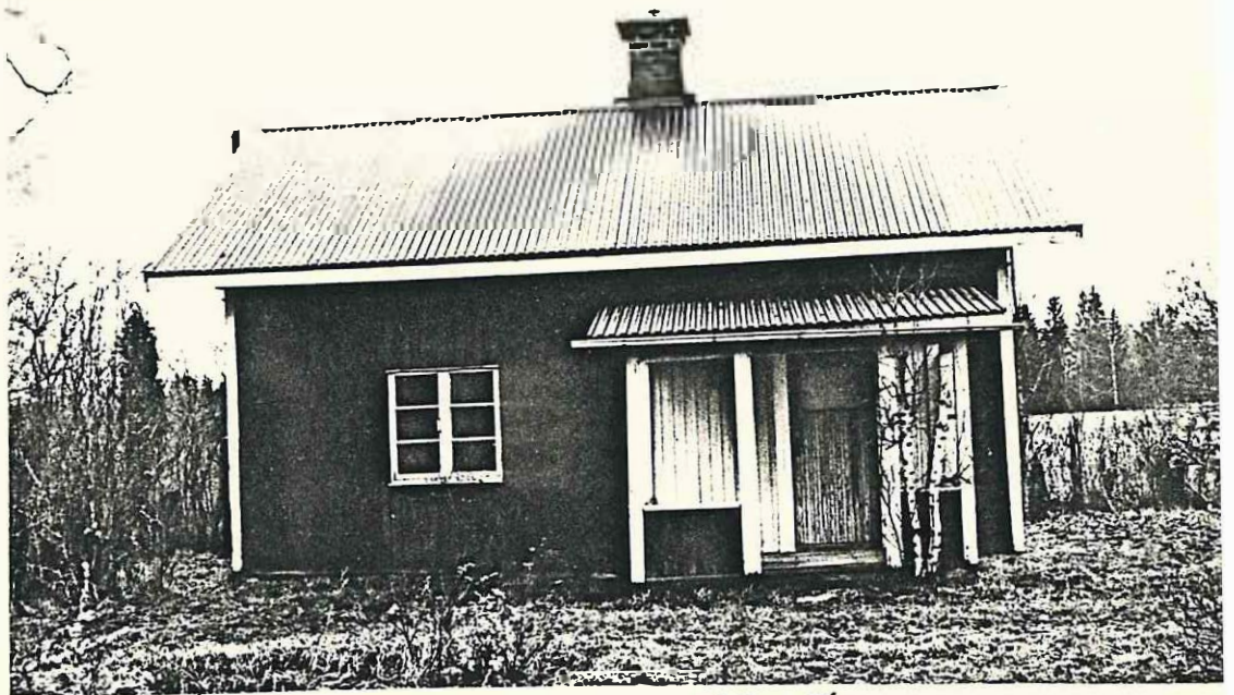
Valin stugan . 1987