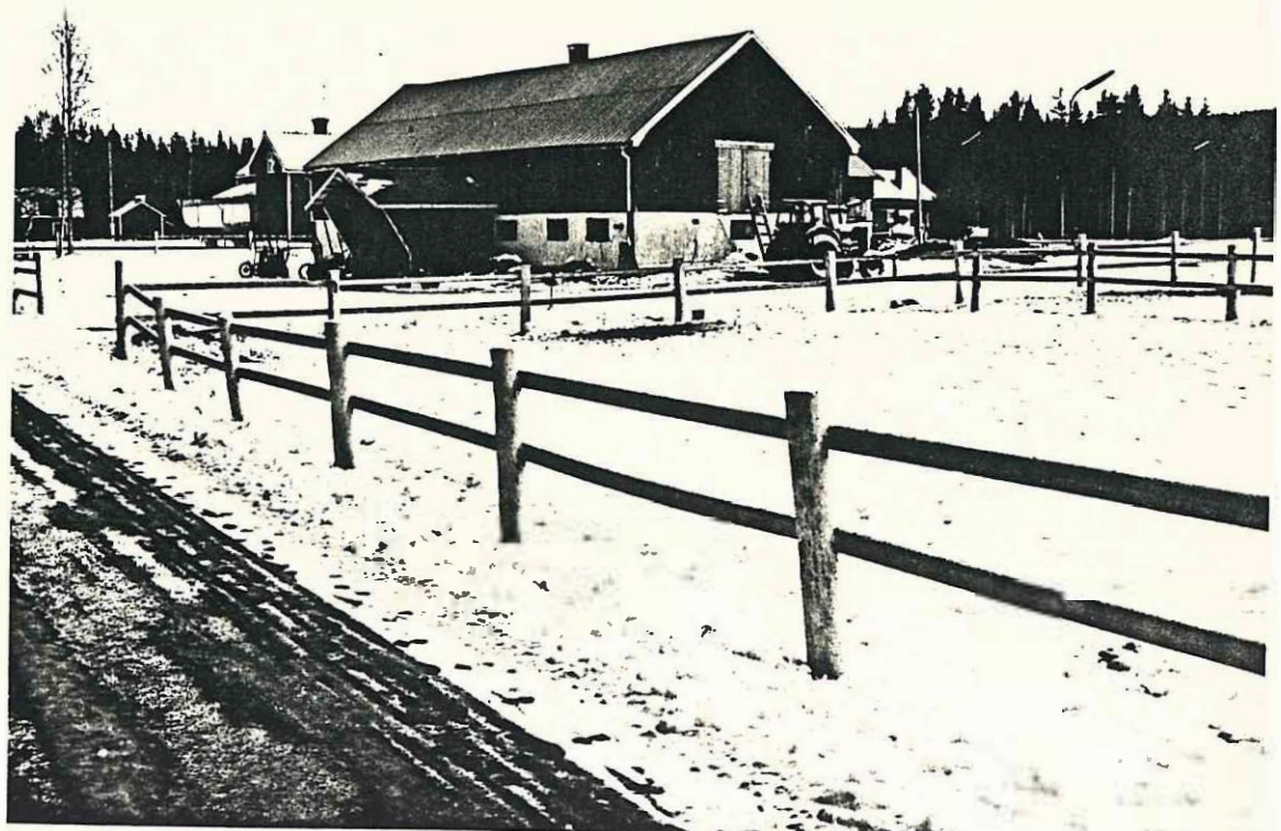
Travstall ligger mellan sätter- mansstallet och Hildastället

Uthuset tillhör Ransåters trav- bana som kallas Hildavällden