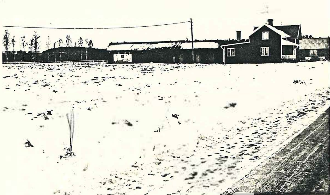
Sättermansstället. Åmenheden Rudheden 1:21