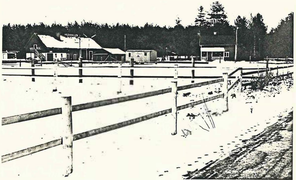
Hildastället Åmenheden Rudsheden 1:33

Uthuset tillhör Ransåters trav- bana som kallas Hildavällden