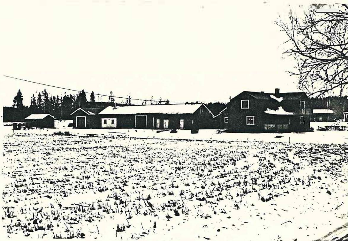
Kjellbergsstallet Åmenheden Rudsheden 1:22