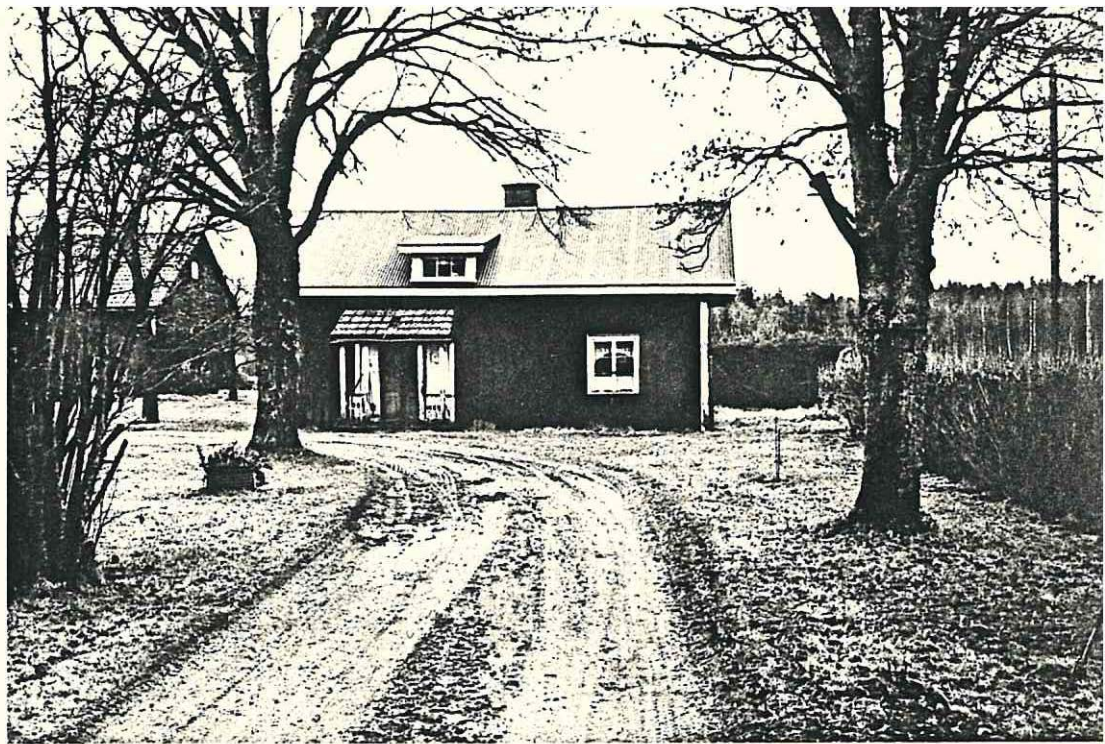
DÄR Nol på Rösshea Gamla stugan 1987