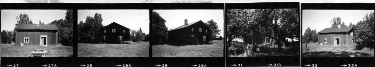
I I I I I