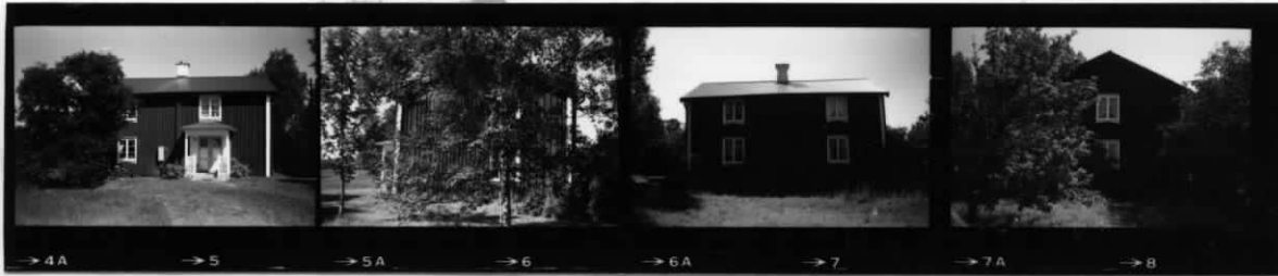
I I I I