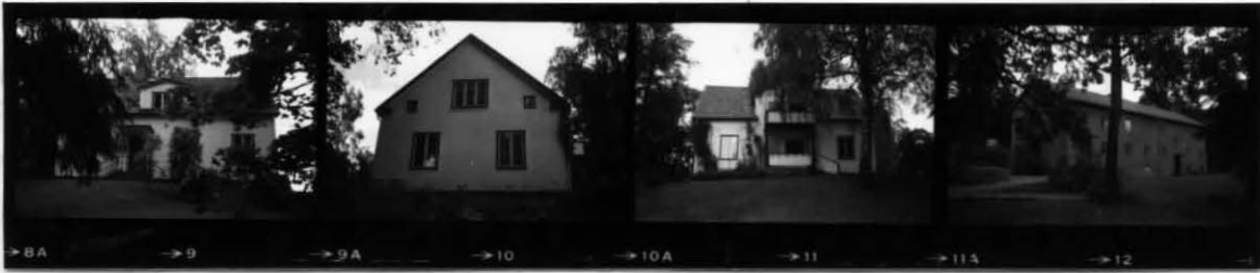
XIII XIV XIV XV XV