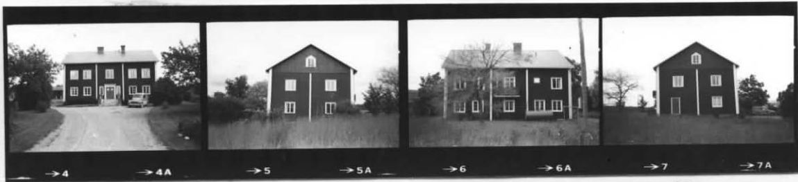
I I I I