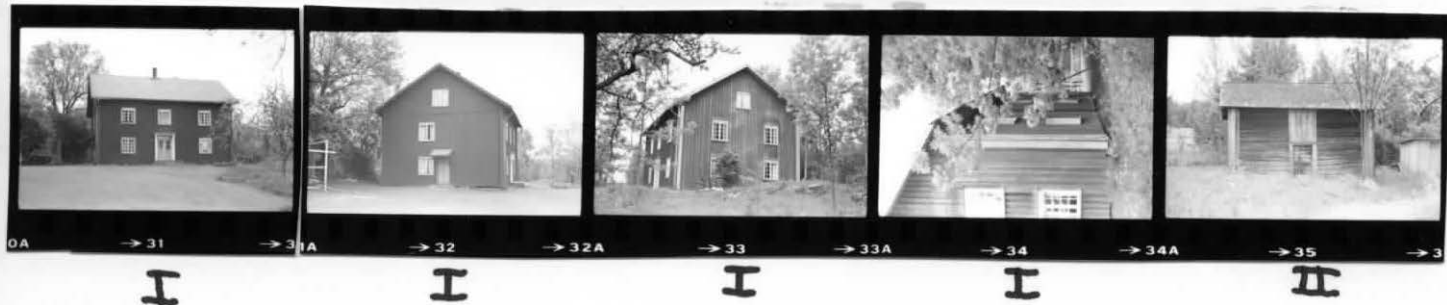
→ 31 → 31A → 32 → 32A → 33 → 33A → 34 → 34A → 35 → 3