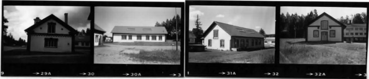
VI VII VII VIII, VIII