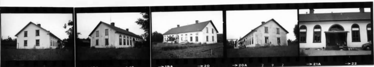
→15A →16 →17A →18 →19A →20 →20A 2 9 2 →21A →22