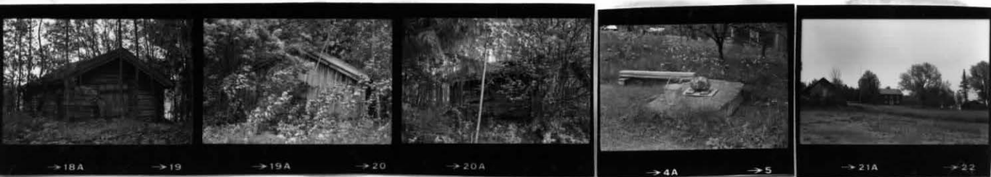
→ 18A → 19 → 19A → 20 → 20A → 4A → 5 → 21A → 22