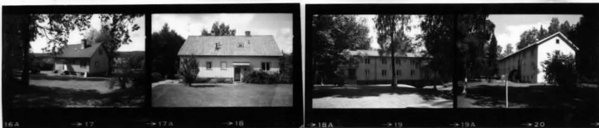
XIX XX XX XXI