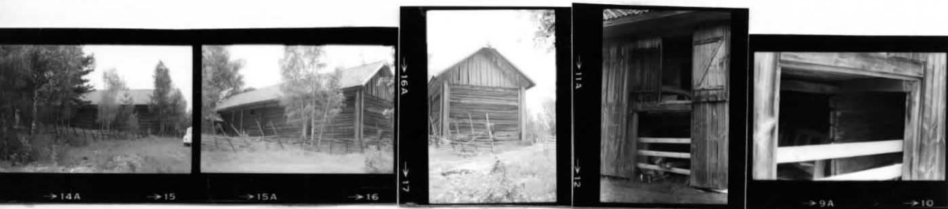
→ 14A → 15 → 15A → 16 → 17 → 11A → 12 → 9A → 10