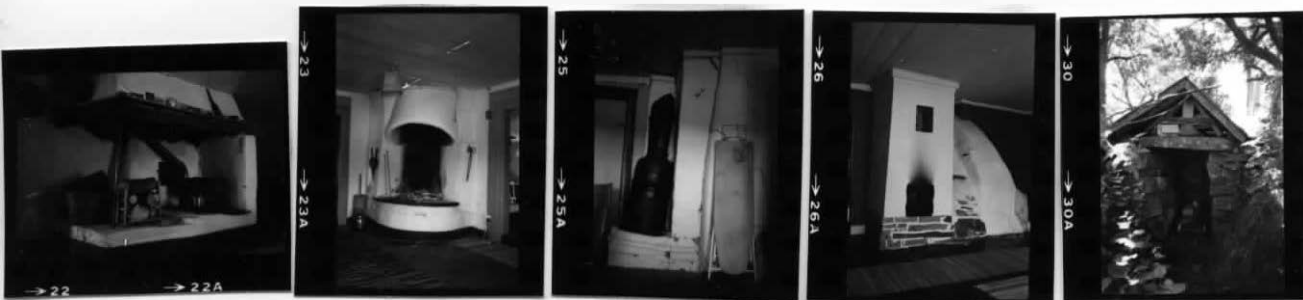
I Kök b.v. I Rum b.v. I SOVRUM b.v. I SOVRUM ö.v. II