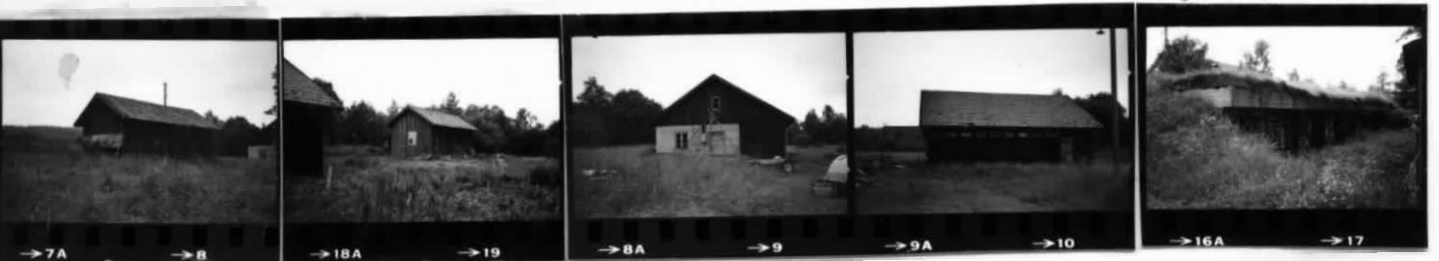
→7A →8 →18A →19 →8A →9 →9A →10 →16A →17