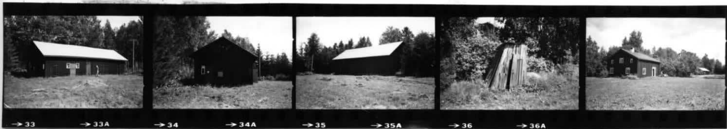
III III IV VI ÖVERSIKT