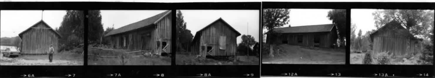
→ 6A → 7 → 7A → 8 → 8A → 9 → 12A → 13 → 13A → 14