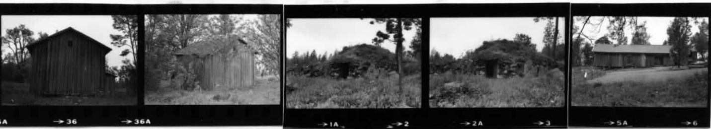
→ 36 → 36A → 1A → 2 → 2A → 3 → 5A → 6