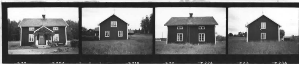
I I I I