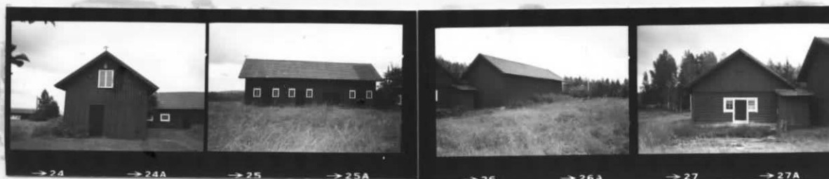
II, III II II, III III, II