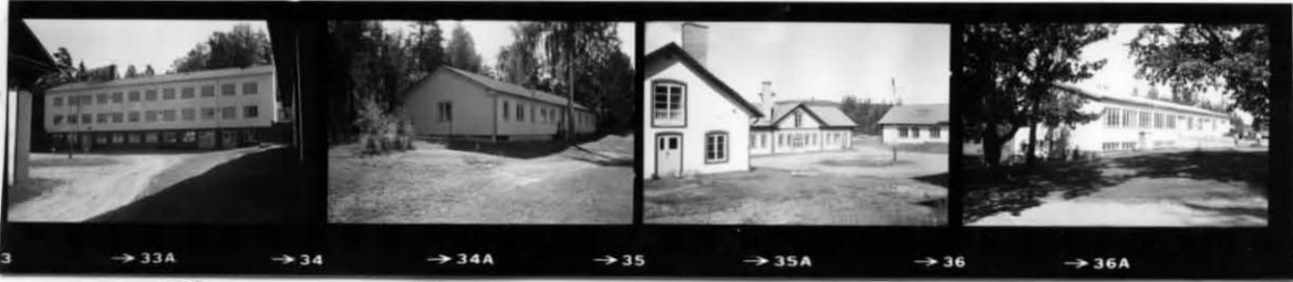
VIII IX MILJÖ B. X