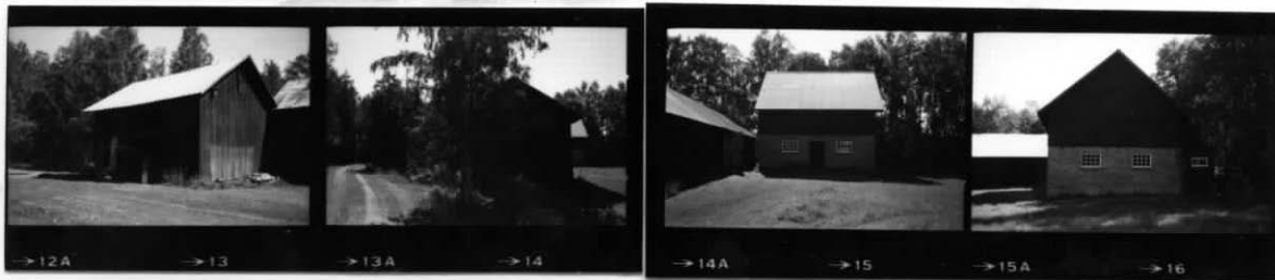
IV, III IV V II, V