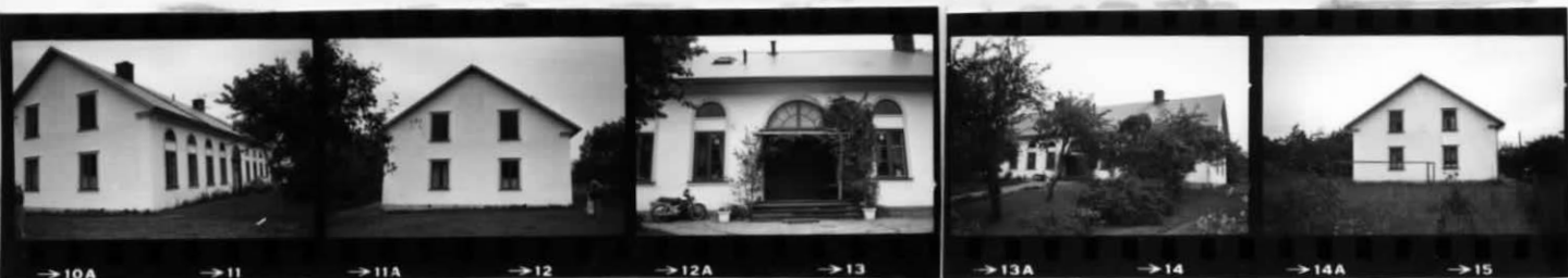
→10A →11 →11A →12 →12A →13 →13A →14 →14A →15