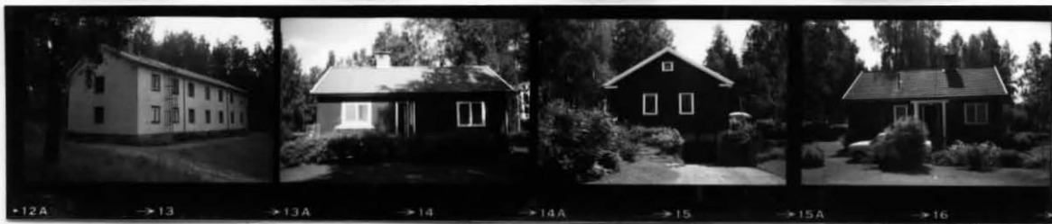
XVI XVII XVII XVIII