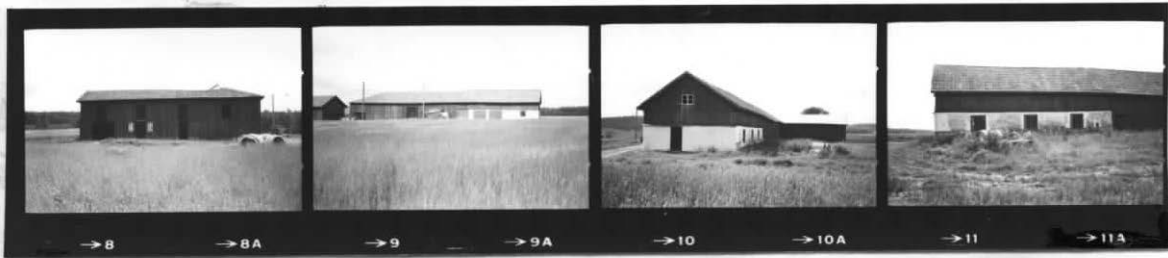
II III + II II II