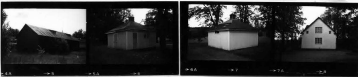
XI XII XII XIII