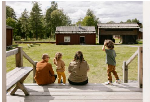
Västerbottens museum - Gammlia