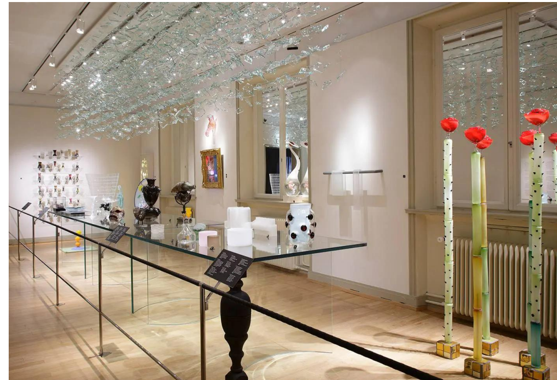
Kulturparken Småland - Sveriges glasmuseum