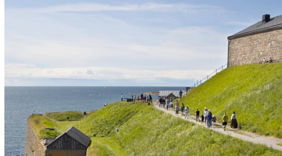
Hallands Kulturhistoriska museum