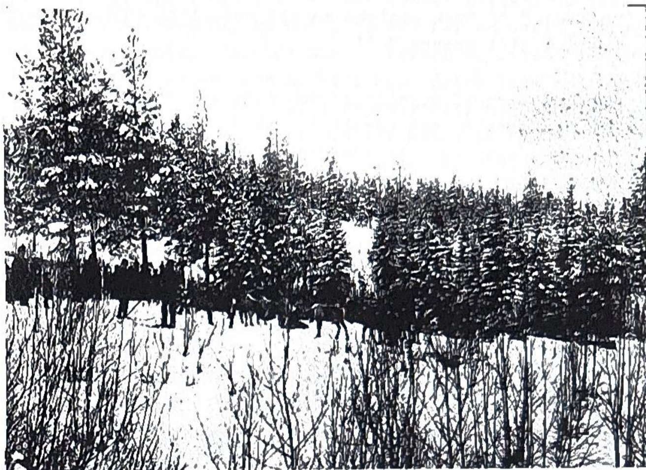
Renar på Sidsjön. 1901.

Renhjorden hade sina betesmarker uppefter sluttningarna mot Södra Berget.