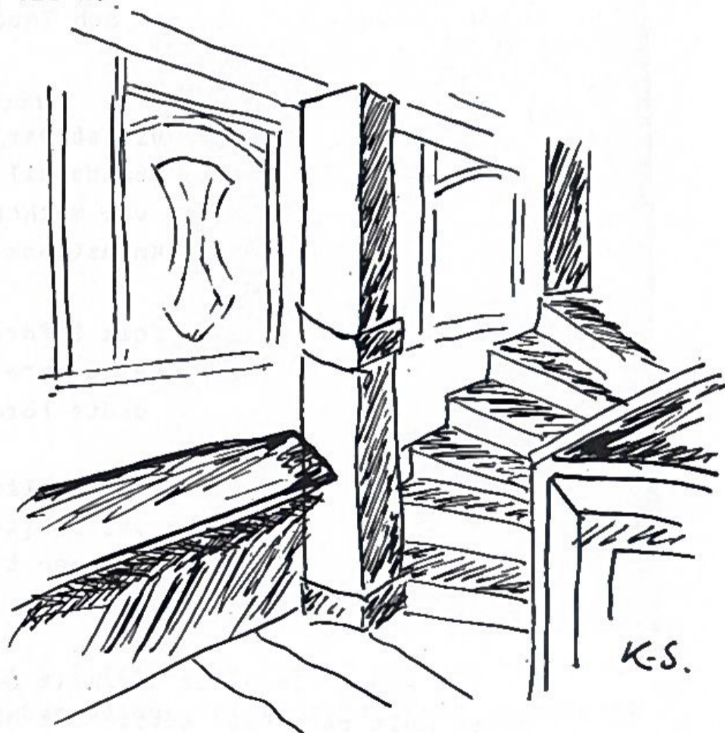
Lappbänken i Ramsele gamla kyrka.

I Ramsele gamla kyrka, som var i bruk fram till 1858, finns lappbänken längst bak i kyrkan. den är placerad mellan traporna upp till de två läktarna och bakom fattighjonens bänk. Det är en smal ca 1,5 meter lång bänk mot kyrkväggen. Att det byggdes en särskild bänk för samerna tyder på att de var återkommande och stadigvarande kyrkobesökare, dock inte så att de fick sitta med den övriga församlingen, vilket kanske har sin förklaring i att alla kyrkobesökare hade sina bestämda platser på den tiden.