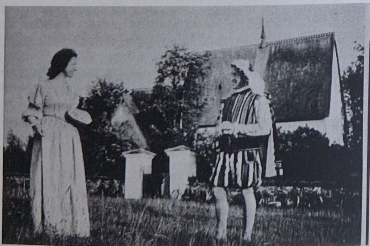
Ett foto av spelet om Karin Månsdotter.