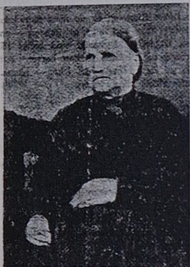
Stödes första barnmorska

Denna artikel var införd i Sundsvals Tidning någon gång under 1930-talet.