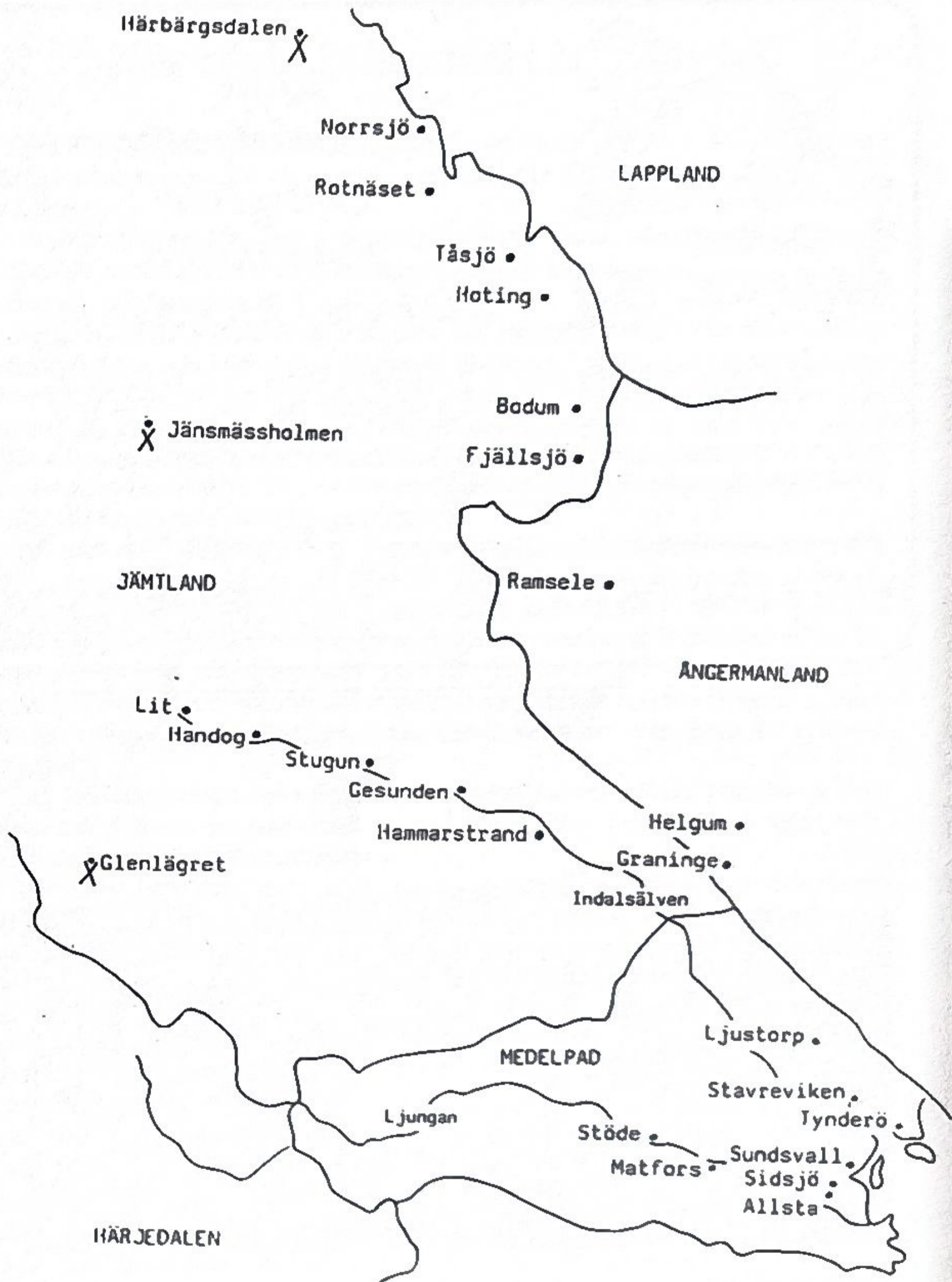
Samernas vandring till vinterbeten i Medelpad.