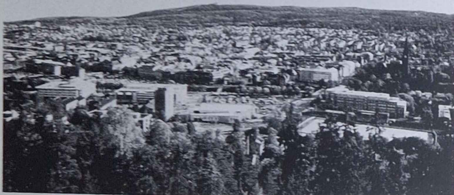
Utsikt mot stenstaden.